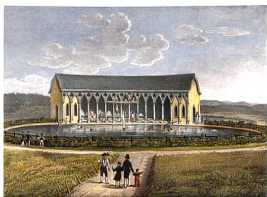
Hofwil → 44