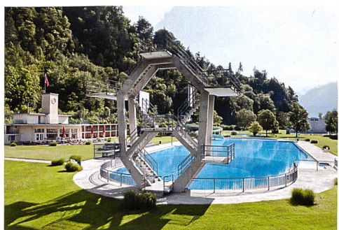
Interlaken → 29