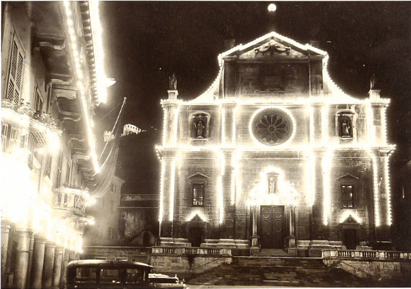
La chiesa Collegiata illuminata a festa in occasione del Tiro federale svoltosi a Bellinzona nel 1929.

Un'illuminazione particolarmente sfarzosa e fluorescente coinvolse anche altri edifici importanti della città: la Collegiata, la stazione ferroviaria, il Municipio, il palazzo governativo e quello postale. La creazione più originale fu senz'altro la sagoma di un tiratore sdraiato, allestita con ghirlande di lampadine disposte a 40 cm di distanza l'una dall'altra. La figura del tiratore, lunga ben 80 m, si stagliava sulla collina di Artore, che sovrasta la stazione ferroviaria. Per incoraggiare i privati ad illuminare esternamente le loro case, l'Azienda elettrica comunale concesse uno sconto del 50% sulla tassa di consumo durante i 17 giorni del Tiro federale.