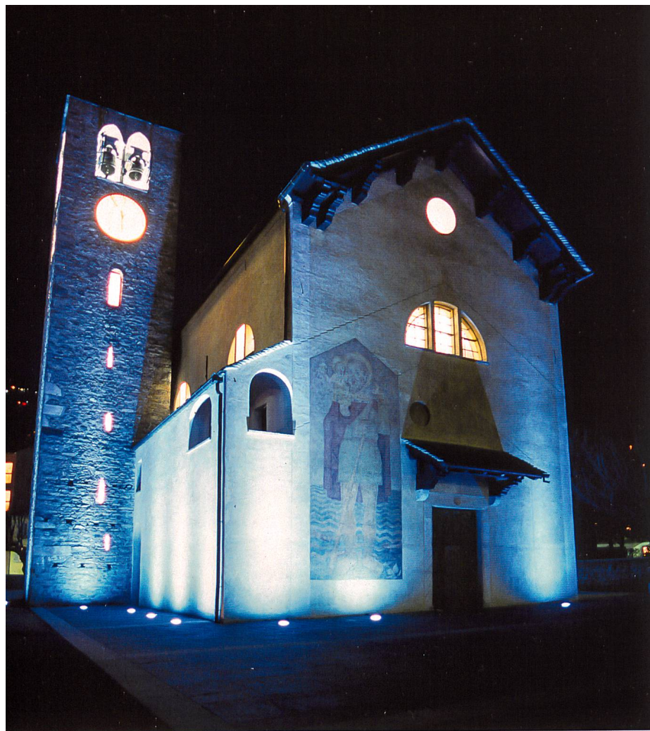
Chiesa parrocchiale Santa Maria Assunta, Giubiasco.