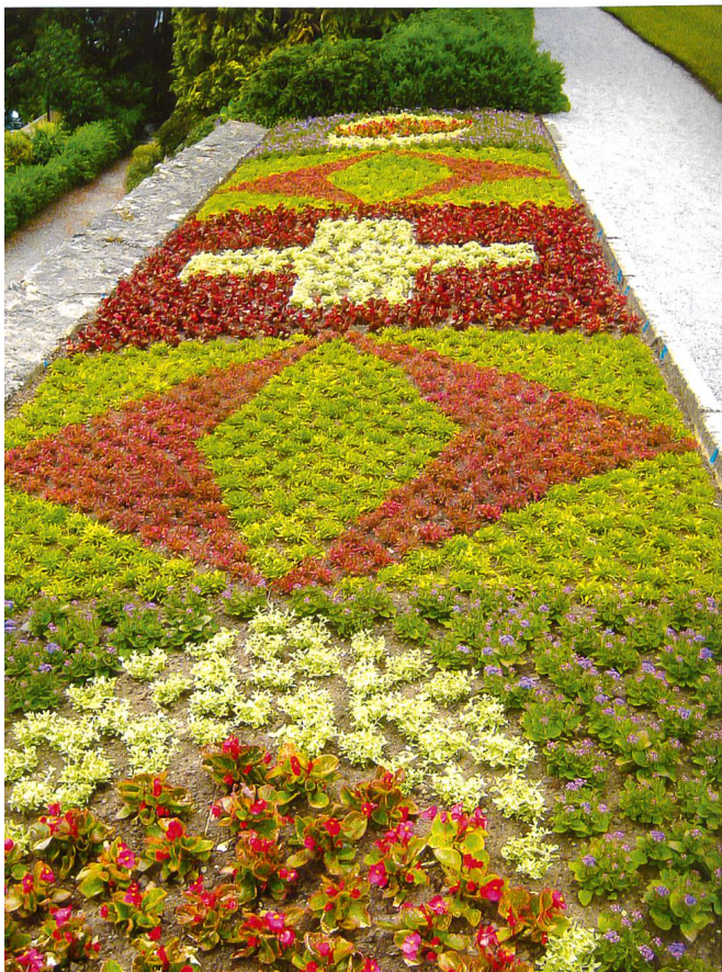
Teppichbeet im Schlosspark Oberhofen mit dem Schweizerkreuz im Zentrum.

Im späten 18. und frühen 19. Jahrhundert wurden auf zahlreichen Entdeckungsreisen in Südamerika oder Ozeanien weitere exotische Pflanzen wie Palmen, Farne oder Orchideen ent-