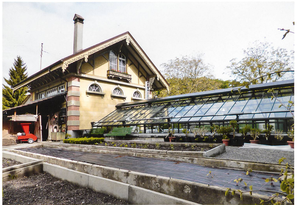
Orangerie von Schloss Spiez mit östlichem Glashausflügel.