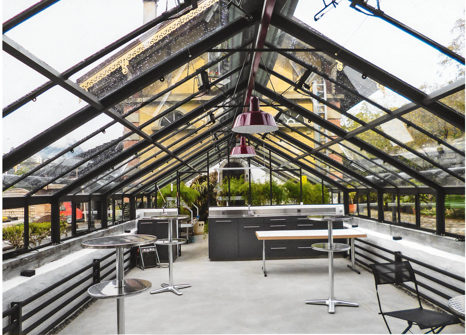
Blick in das restaurierte Glashaus von Schloss Spiez.