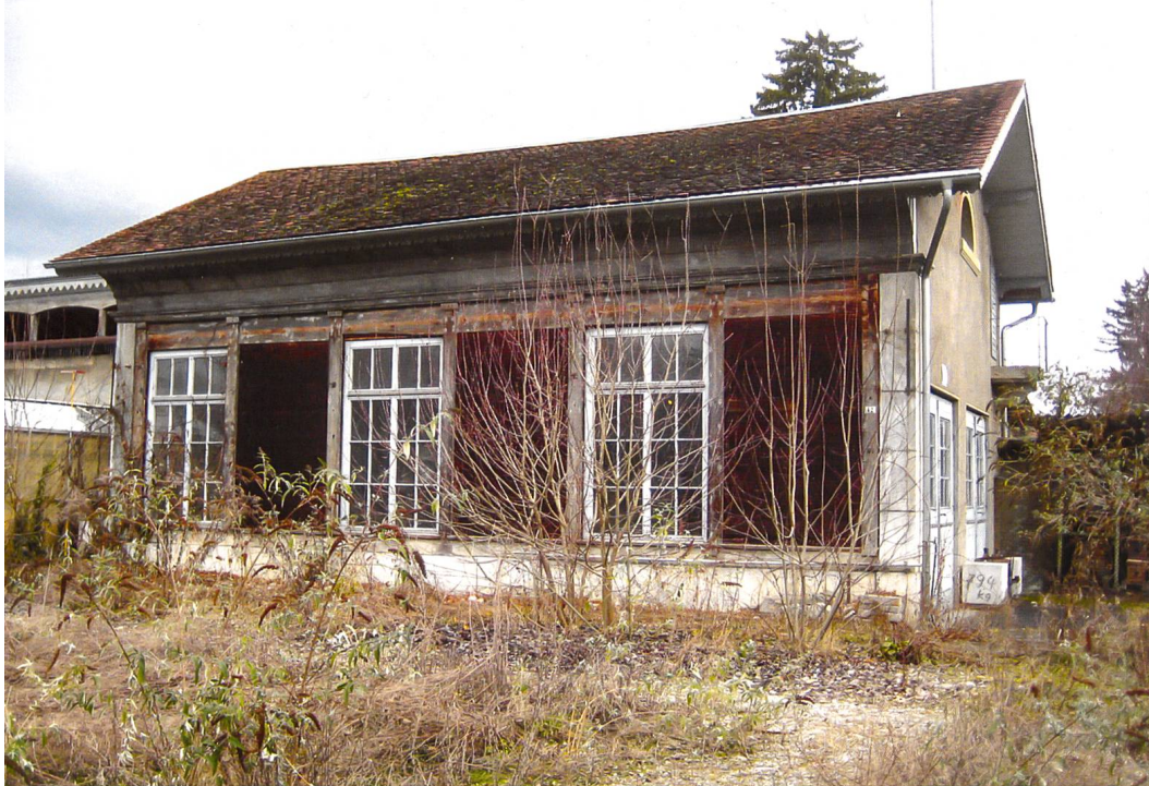
Orangerie bei Schloss Schadau.