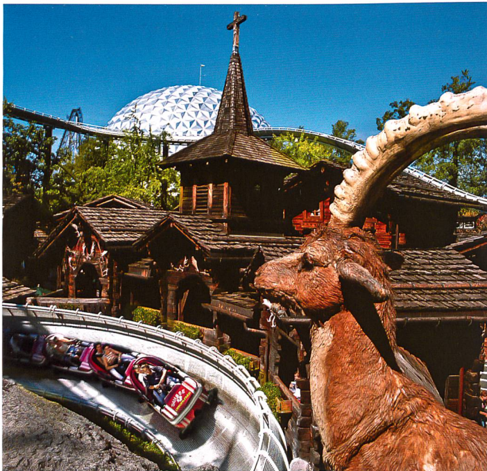
Abb. 6: Achterbahn im Europapark Rust mit Walliser Dorf. Eine moderne Variante des «delightful horror» mit obligatem Schweizerdorf. Der Wasserfall fehlt leider, die Nähe zur Wasserrutschbahn wäre für das gesamte Ensemble noch sinnstiftender gewesen!

Der Gedanke mag angedeutet bleiben, zumal er auf ein neues und weites Feld zuführt. Für das davor Festgehaltene lässt sich aber resümieren, dass der Wasserfall als Phänomen der Frühen Neuzeit in besonderer Weise mit der Schweiz verbunden ist: Ein Schweizer, Carlo Maderno, zeichnete verantwortlich für die erste richtige Kaskade, der Schweizer Wasserfall in seiner freien Form hat nach Scheuchzers Vorstoss unzählige Reisende im 18. Jahrhundert inspiriert, und aus dem Wunsch, diese Begegnung fortauern zu lassen, ist allmählich jener Landschaftspark hervorgegangen, in dem künstlicher Wasserfall, künstliche Felsen und Schweizerhaus eine enge Verbindung eingegangen sind. So eng, dass umgekehrt der natürliche Wasserfall allmählich in die gleiche Kombination eingespannt und damit neuerlich ästhetisch gezähmt wurde. Die Schweiz und der Wasserfall waren eine Erfolgsgeschichte. Zwar wird sie in dieser Form nicht mehr künstlich vereinigt, aber die Vereinigung von Chalet suisse und «delightful horror», heute freilich in der Form einer Achterbahn, gibt es immer noch (Abb. 6). ●