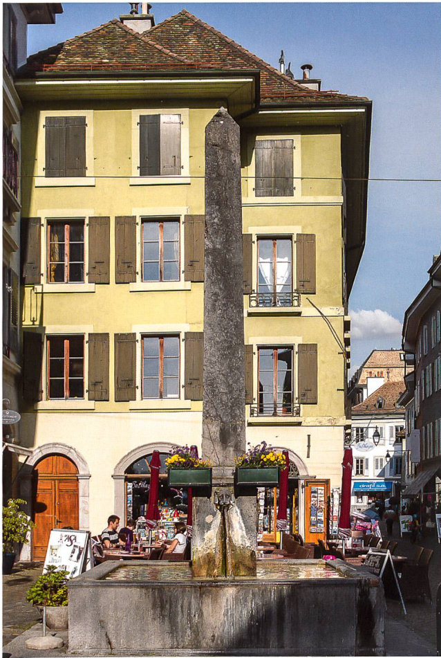
Fig. 11 Fontaine du Sauveur. David IV Doret (att.), 1817.