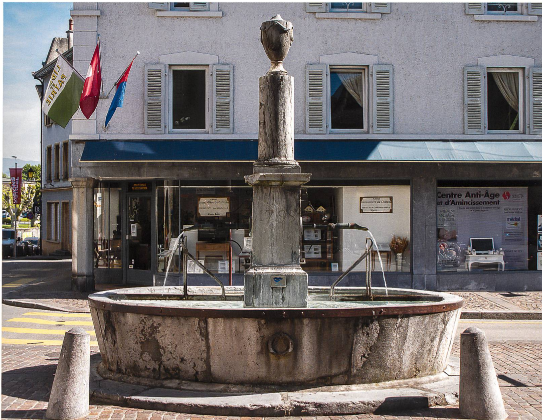
Fig. 10 Nyon, fontaine de la Liberté. Jean-François Doret, 1798.

doivent fournir un plan et un devis» 4 . La statue reprend place sur un nouveau piédestal élaboré par l'artiste et le marbrier l'année suivante. Leur collaboration ne s'arrête néanmoins pas à ces trois œuvres veveysannes. En laissant de côté ici les monuments funéraires à l'exemple du sarcophage à l'antique de la princesse russe Catherine Orlov (1751-1782) à la cathédrale de Lausanne, une autre fontaine présente des caractéristiques communes à celles de la place Orientale et de la tour Saint-Jean. Ornée d'un obélisque, la fontaine de l'esplanade de Valency à Lausanne rappelle assurément la manière de Brandoin, bien qu'elle se trouve en deçà des limites du bourg veveysan.