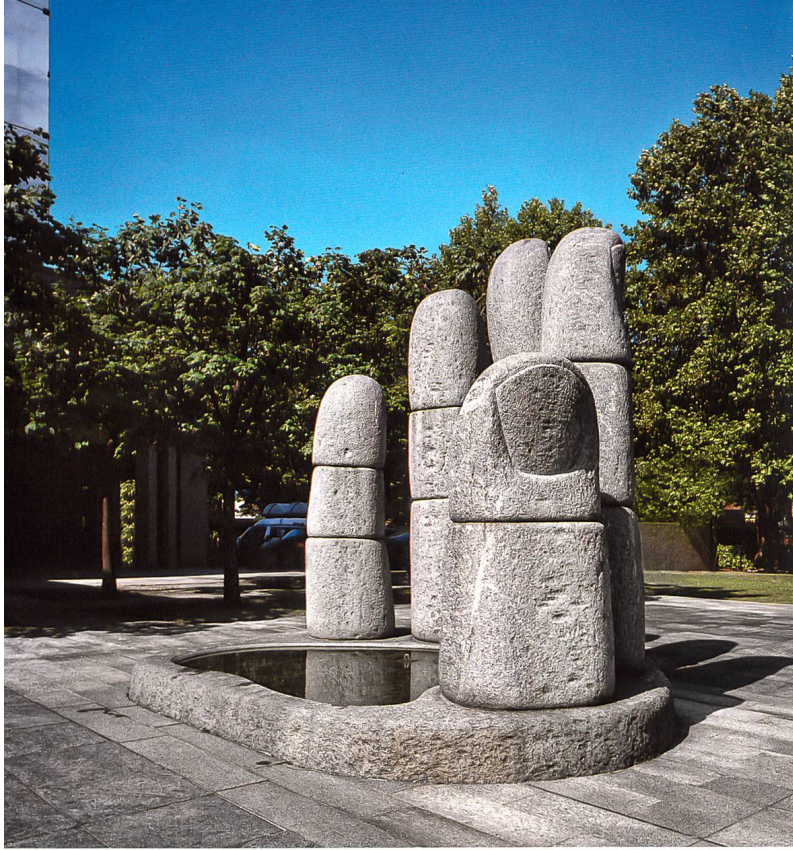
Ill. 5 Grande mano, 1985. Banca dello Stato, Bellinzona.