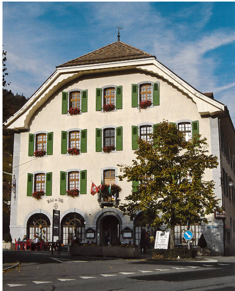
Fig. 12 Ollon, Hôtel de ville construit en 1781-1782. Arcades du rez-de-chaussée semblables à celles de Bex. Restauré et transformé en 1987-1989. Etat 2014.

réaffirmant sans cesse la structure verticale de la société de l'Ancien Régime.