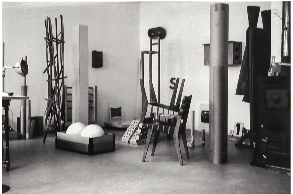
Das Atelier von Eric Hattan, Basel 1993.