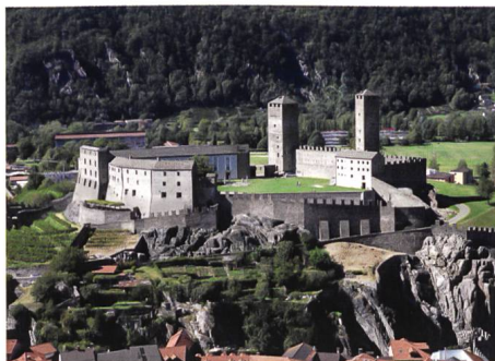
Bellinzona → 69