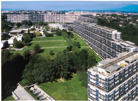
Genève → 60