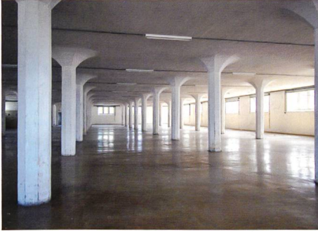
Altdorf → 7