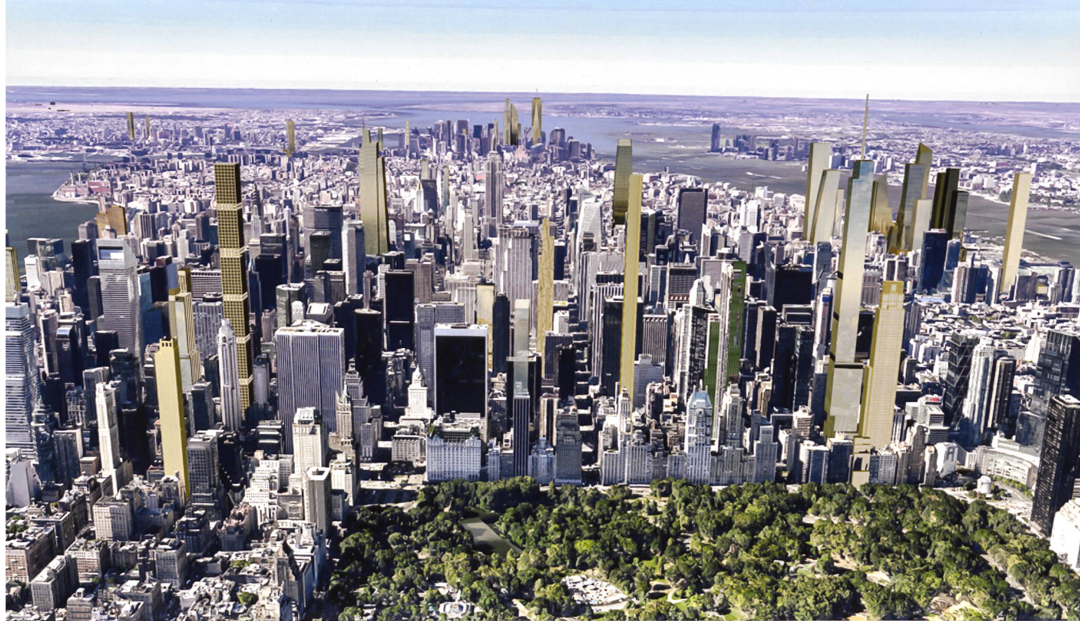
Ill. 5: New York, Midtown Manhattan come sarà nel 2018 una volta completati i grattacieli oggi in costruzione.

«suburbanizzazione» del mondo. Si formano nuovi spazi dell'esclusione che sono altrettante bombe a orologeria nell'orizzonte della democrazia.