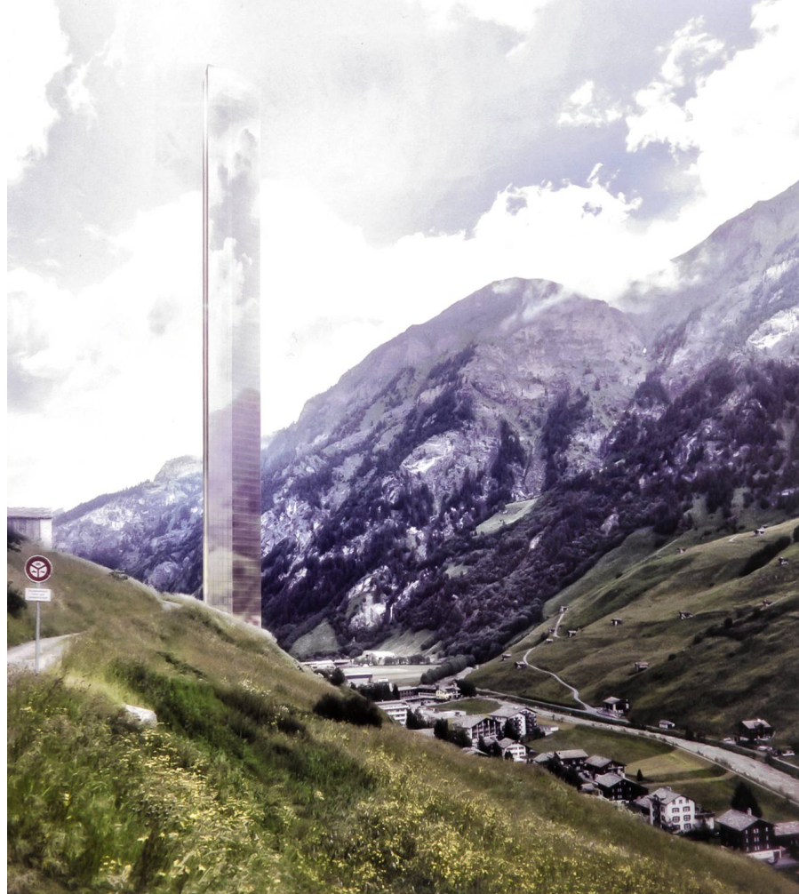
Ill. 7: La torre più alta di Europa. Rendering del grattacielo progettato a Vals, Grigioni (2015).

ecologia, tutela, restauro, beni culturali e quant'altro. Lo scopo di tutto questo è uno solo: lo stupro. Ma siccome nessuno stupratore confessa di esserlo, e meno ancora vuol farsi cogliere sul fatto, ecco che i capaci petti di deputati e commendatori si gonfiano di obiettivi e metafore, alta retorica e fervore lirico». 10