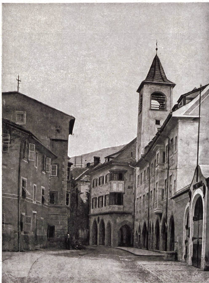
Abb. 133. Das neue Postgebäude (von Th. Fischer) in Hall in Tirol.

Der österreichische Architekt und Historiker Friedrich Achleitner schrieb im Hinblick auf den Heimatstil der Zwischenkriegszeit einmal: «Das ideologische Bindemittel dieser Baukultur ist jedoch flüssig, es ist, wie wir alle wissen, das