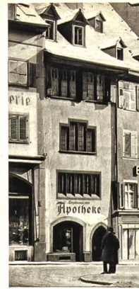
NACH DEM UMBAU