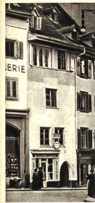
VOR DEM UMBAU