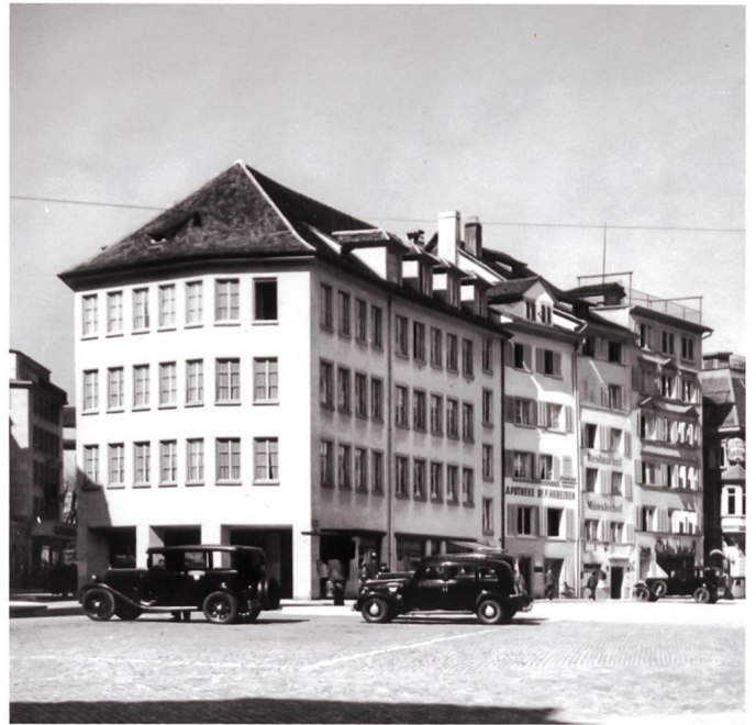
Abb. 5/6 Ersatzneubau am Münsterhof: die beiden abgebrochenen Häuser und das neue Haus «zum Münstereck» von Ernst und Bruno Witschi, 1938 (Aufnahmen 1919 und kurz nach Fertigstellung).