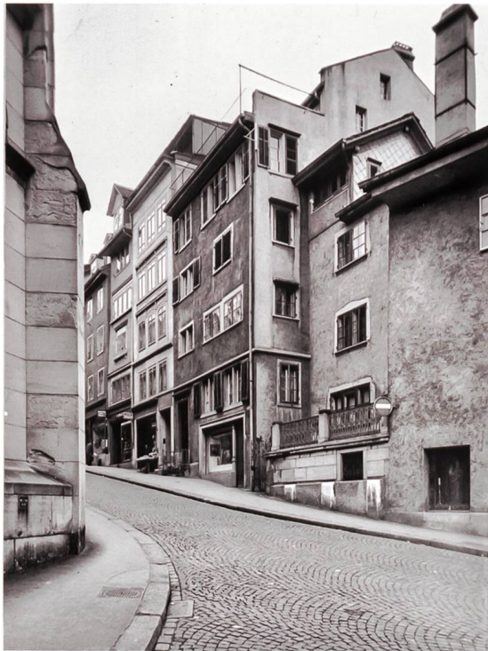
Abb. 7/8 Ersatzneubau im Rahmen der Altstadt-sanierung an der Kirchgasse 24: das abgebrochene Haus «zur Musegg» und der Neubau von Max Kopp, 1956 (Aufnahmen 1955/1963).