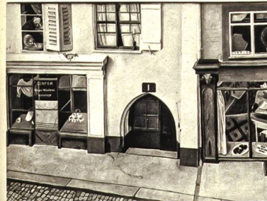
NIKLAUS STÖCKLIN, BASEL RHEINGASSE 1 ÖLBILD

geringen Geschosshöhen von Erdgeschoss und 1. Stock reichten eben aus, um ein ordentliches Verkaufsal mit Galerie als Arbeitsraum einzubauen — die Fensterreihe über dem Erdgeschoss zeigt deutlich diese Veränderung der Bestimmung. Der zweite Stock wurde zum Wohn-, der dritte zum Schlafgeschoss hergerichtet. Der Umbau ist im Jahre 1921 durchgeführt worden.