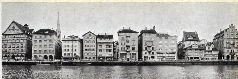
Der Limmatquai, wie er sich von der Schiffe aus gesehen heute darstellt.

Auf dem unteren Bild wurde ein als ‚guter Neubau‘ ausgezeichnetes Geschäftshaus aus dem Sihlquartier versuchsweise an den Limmatquai versetzt (Photomontage). Die unerfreuliche Wirkung ist offensichtlich: der viel zu große Bau stört den Maßstab, die horizontale Gliederung widerspricht der vertikal geteilten bisherigen Bebauung. Auch die Baustoffe Glas und Stahl sind hier am falschen Ort.