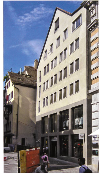
Abb. 13 Häuser (zum Goldenen Schwert) und (zur Apotheke), Marktgasse 12/14, abgebrochen im Rahmen der Altstadtsanierung 1949.