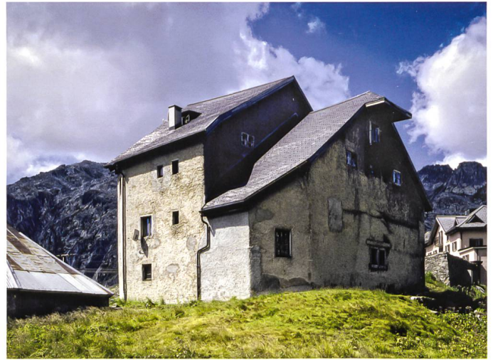
Ansicht von Süden und von Nordosten, vor dem Umbau 2008–2010.

tet hatte, sämtliche Kosten für Bau und Unterhalt zu tragen, fand schliesslich im Jahr 1623 die Grundsteinlegung statt. Das Hospiz der Seelsorger wurde nach den Plänen eines Urner Hauptmanns namens Besler neben dem Hospiz der Gemeinde errichtet und schloss direkt an die Südwand der Kapelle an. 4 Es beinhaltete zwei Räume im Erdgeschoss und zwei im Obergeschoss. Arme Reisende erhielten Verpflegung und Unterkunft umsonst, wer es vermochte, kam für die Unkosten auf. Ein späterer Erzbischof, Federico Visconti, liess 1683 «ein grösseres und komfortableres Gebäude» 5 erstellen und vertraute es den Kapuzinern an. Vier Jahre später wurde die Kapelle durch Antonio Rossalino vergrössert, an die Stelle der halbrunden romanischen Apsis trat nun ein fünfeckiger Chor.