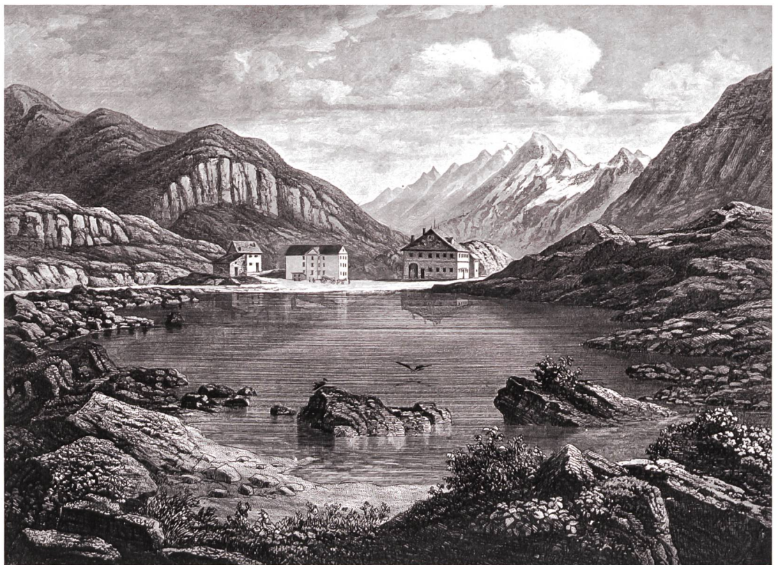
Aquatinta Hospice du St. Gothard , gezeichnet von Anton Winterlin, gestochen von Lukas Weber, herausgegeben von Christian Krüsi, 1871.

Der Erzbischof von Mailand, St. Galdinus, liess während seiner Regentschaft 1166 bis 1176 die Passkapelle vergrössern. Sein Nachfolger, Enrico da Settala, weihte sie im Jahre 1230 dem heiligen Gotthard, auch Godehard genannt, womit der Ort seinen Namen erhielt. 1 Sankt Gotthard gilt als Schutzheiliger der Handelsreisenden und wurde Namensgeber zahlreicher Kirchen im Alpenraum. Zu seiner Verehrung wurden alljährlich Wallfahrten von den umliegenden Talschaften zur Gotthardpasskapelle hinauf abgehalten. 2