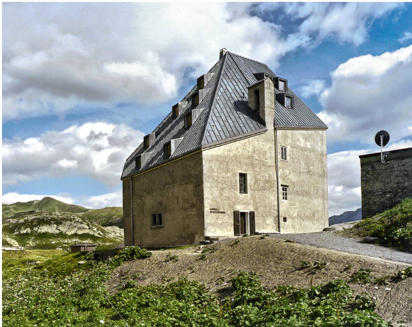
Ansicht der Westseite, 2012.