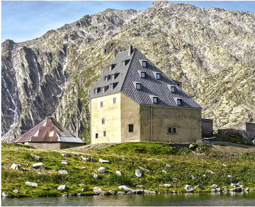
Ansicht der Ostseite, 2012.

pengiebel aus Granit charaktervoll und einprägsam. Demgegenüber bezieht das Gotthardhospiz seine Bedeutung ganz aus seiner hohen geographischen und geschichtlichen Stellung.