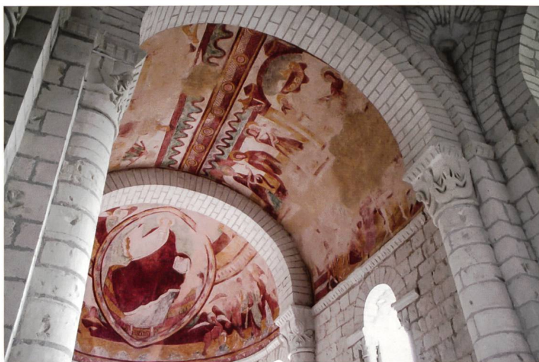
St-Nicolas de Tavant, Fresken aus dem 12. Jahrhundert

Benedikt Loderer konstatiert einen Riss, der durch die Schweiz geht: ein Riss zwischen «Schönschweiz» und «Verbrauchsschweiz» sowohl in der Landschaft wie in den Köpfen der Menschen. Tourismusorte haben in diesem Spannungsfeld einen besonders para-