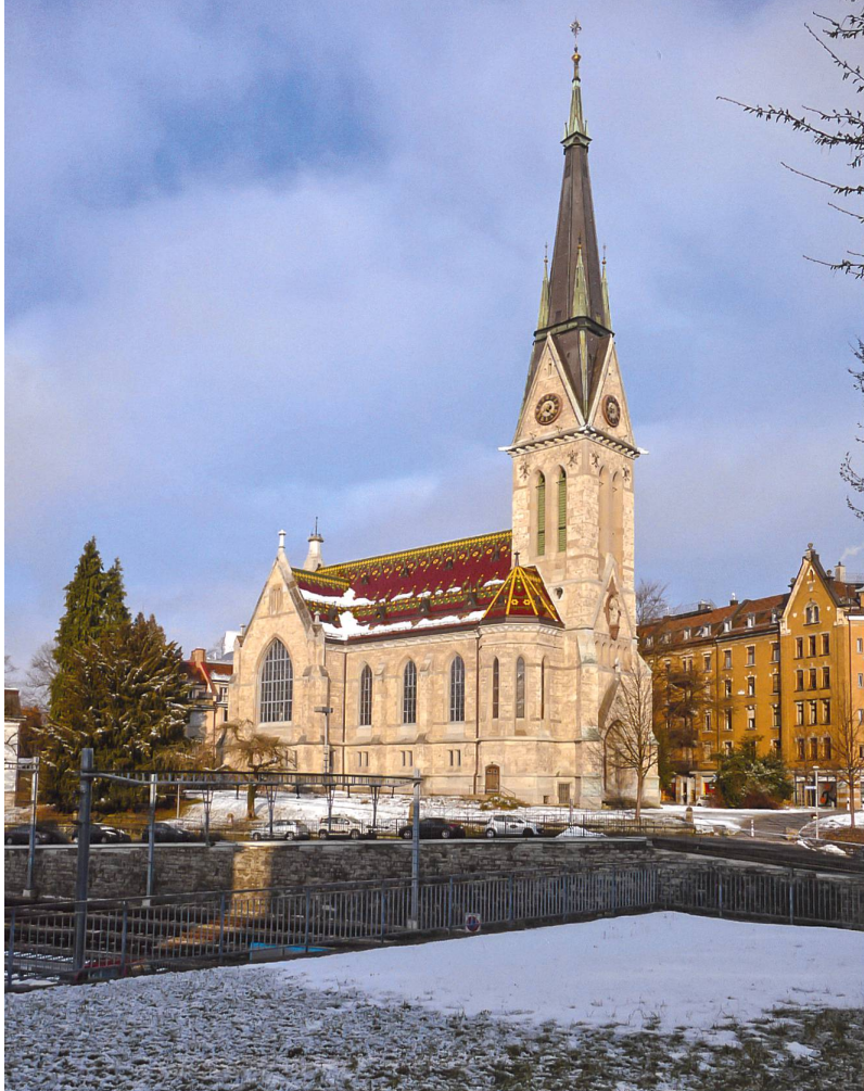
Abb.9 Kirche St. Leonhard in St. Gallen, 2005 an einen Architekten verkauft, seither ungenutzt.