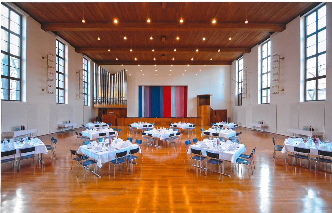
Abb. 8 Gemeindehaus Ökolampad in Basel, an Bildungszentrum 21 vermietet.