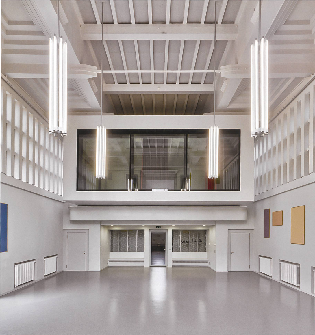
Abb. 6 Temple de Saint-Luc in Lausanne, heute als Maison de Quartier de la Pontaise genutzt.