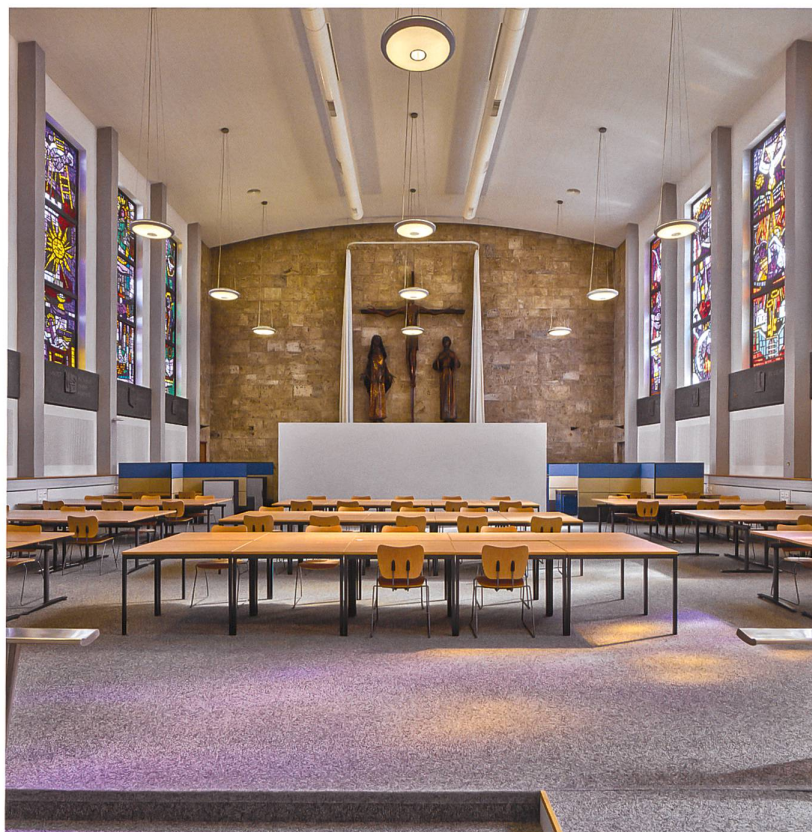
Abb. 4 Kapelle Regina Mundi in Fribourg, heute als Lesesaal der Universität genutzt.

Um eine Umnutzung durch eine öffentliche Institution handelt es sich auch beim Temple de Saint-Luc in Lausanne, der heute Maison de Quartier de la Pontaise heisst (Abb. 6). Die Kirche gehört seit je der Stadt (eine Spezialität der reformierten Kirchen in Lausanne), die das Gebäude, zusammen mit einem neu errichteten Anbau, 2013 unter die Obhut der öffentlich subventionierten Fondation pour l'Animation Socioculturelle Lausannoise stellte. Ein Verein nutzt das Haus als Quartierzentrum, mit soziokulturellen Angeboten für Kinder, Jugendliche und Erwachsene. Die Räumlichkeiten stehen ausserdem Personen zur Verfügung, die sich mit eigenen Projekten für das Gemeinleben engagieren.