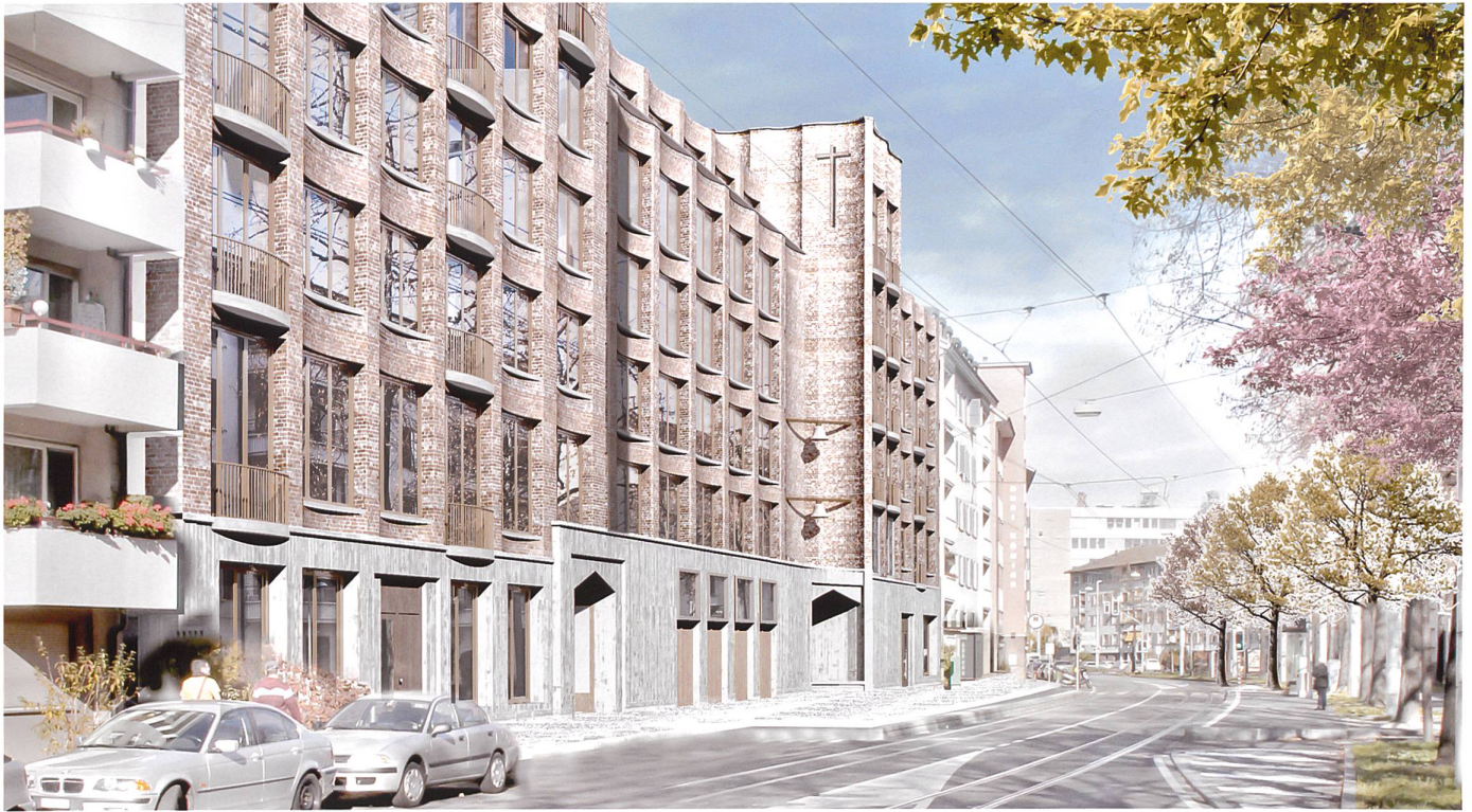
Abb. 3 Kirche St. Christophorus in Basel-Kleinhüningen, Neubauprojekt, 2016, Lorenz Architekten.

Form einer erweiterten Nutzung hat man für die reformierte Matthäuskirche in Basel gefunden (Abb. 1). Als Gemeindekirche wurde sie aufgegeben, stattdessen wird sie nun jeden Sonntag während zwölf Stunden als «Sonntagszimmer» genutzt, mit vielfältigen Angeboten (Gottesdienste, Essen, Filmvorführungen etc.), die sich v.a. an Personen mit Migrationshintergrund richten.