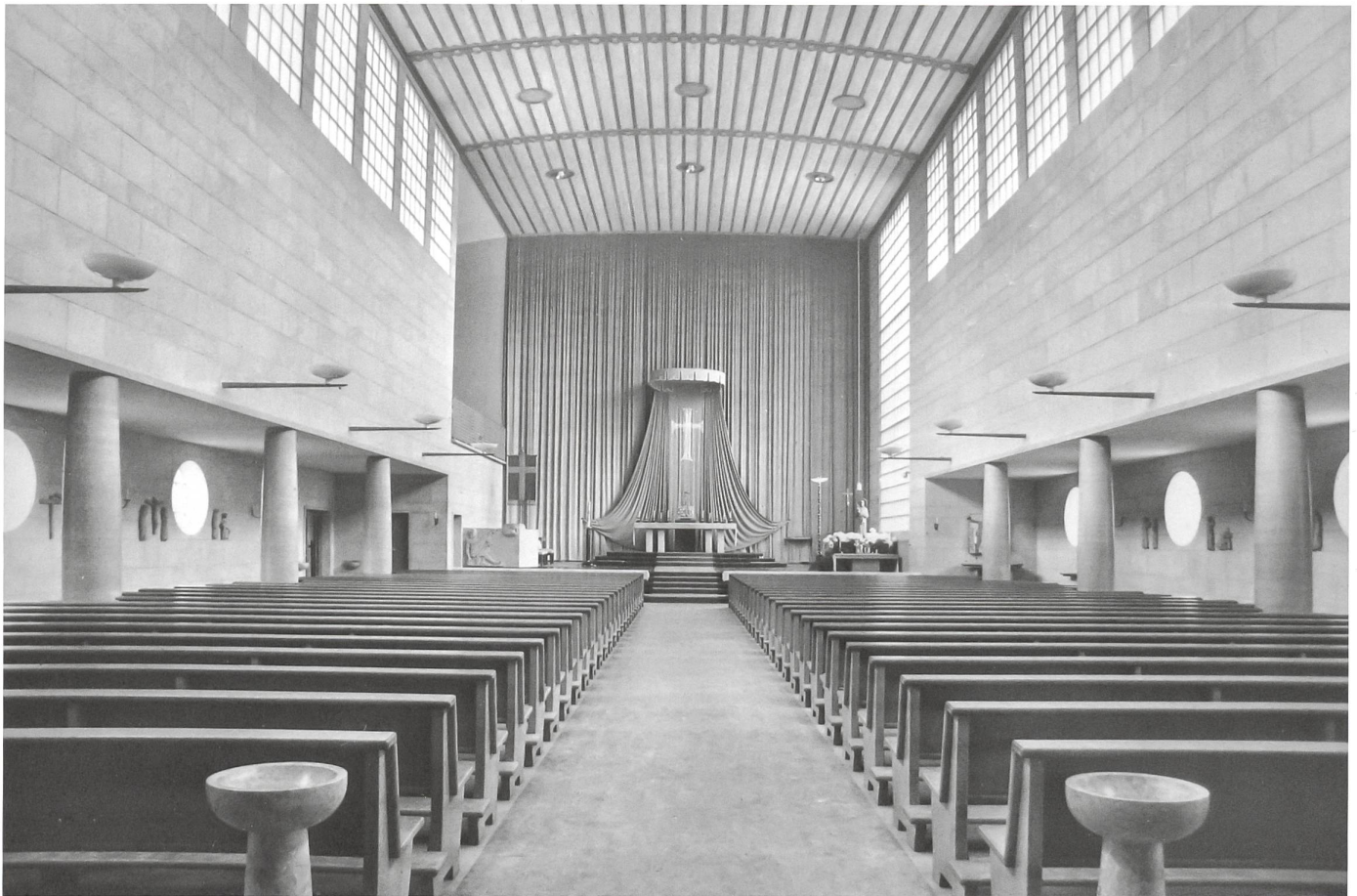
Kircheninnenraum, Blick zum Chor mit Vorhang und Altarbaldachin, links Orgelempore, 1941.

Die Instandstellung und -setzung begann mit materialgerechter Reinigung, dem Flickern, der partiellen Reparatur oder dem Ersatz mit bisherigen Materialien und endete mit allfälligen Retuschen. Aussenputz, Naturstein, Glasmalereien oder die historischen Fenster wurden so behandelt. Die schadhafte Armierungseisen in den Betonpartien wurden durch neue, beschichtete Eisen ersetzt, der Beton reprofiliert, die Oberflächen nachbearbeitet und gestrichen.