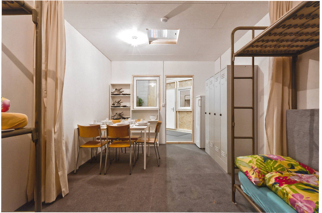
Die Holzbauten in der Kirche haben eine Fläche von rund 3 x 5,5 Metern und enthalten fünf Betten, einen Schrank, einen Tisch, Stühle, einen Kühlschrank, ein Fenster und einen Oblichtschieber zum Lüften.