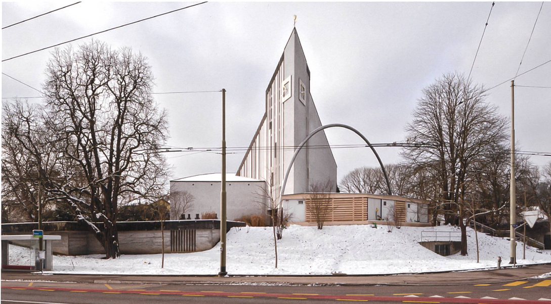
Die Kirche Rosenberg ist mit ihrem dreieckigen Kirchturm eine markante Erscheinung im Quartier.