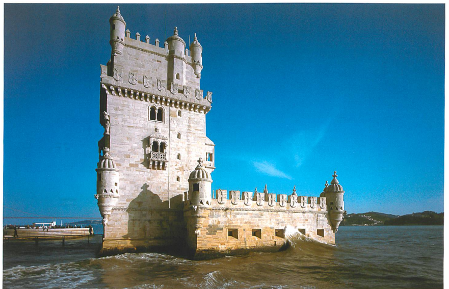
Torre de Belém