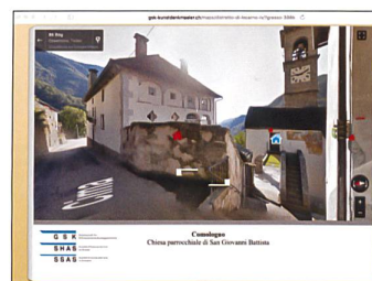
Copertina e-book del Distretto di Locarno IV

Chiesa parrocchiale di San Giovanni Battista, Google Maps, Satellite (in blu la chiesa, in rosso altri beni)