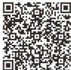
QR-Code pour e-book

La manifestation a été ouverte par Nicole Pfister Fetz, présidente de la Société d'histoire de l'art en Suisse SHAS, qui a rappelé l'histoire du projet de l'inventaire des Monuments d'art et d'histoire de la Suisse MAH dans le canton de Genève : depuis la parution du premier volume en 1997, trois autres tomes ont suivi, dont ce dernier, qui est également disponible sous forme de livre électronique. Par sa continuité et sa durabilité, la série genevoise est un exemple pour le projet national. Nicole Pfister Fetz a remercié toutes les personnes et institutions grâce auxquelles le projet s'est concrétisé, et Ferdinand Pajor, vice-directeur