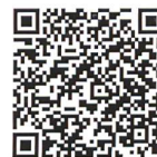
QR-Code per il e-book

Chiesa parrocchiale di San Giovanni Battista, Street View (in blu la chiesa, in rosso altri beni)