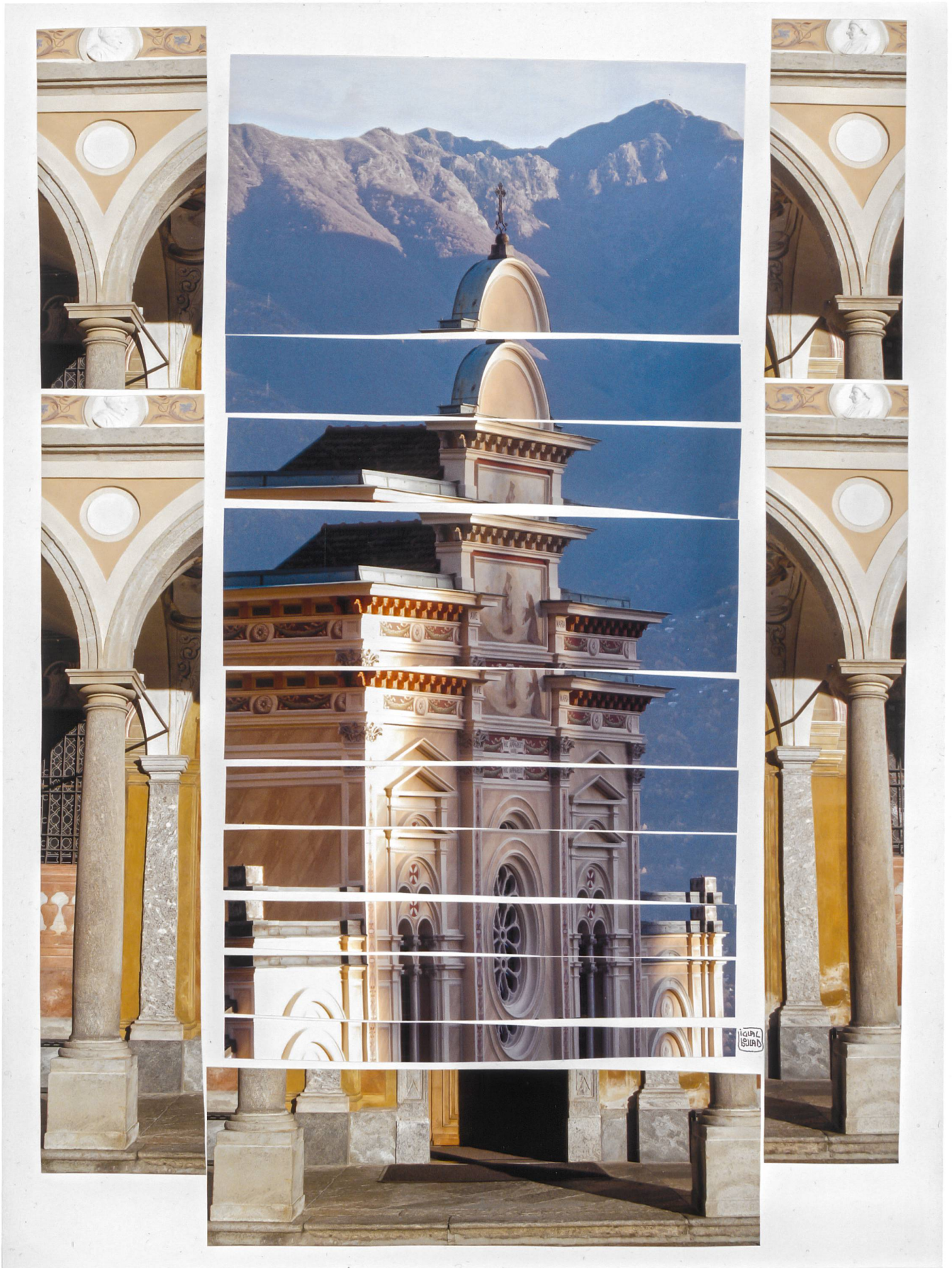
Madonna del Sasso Locarno