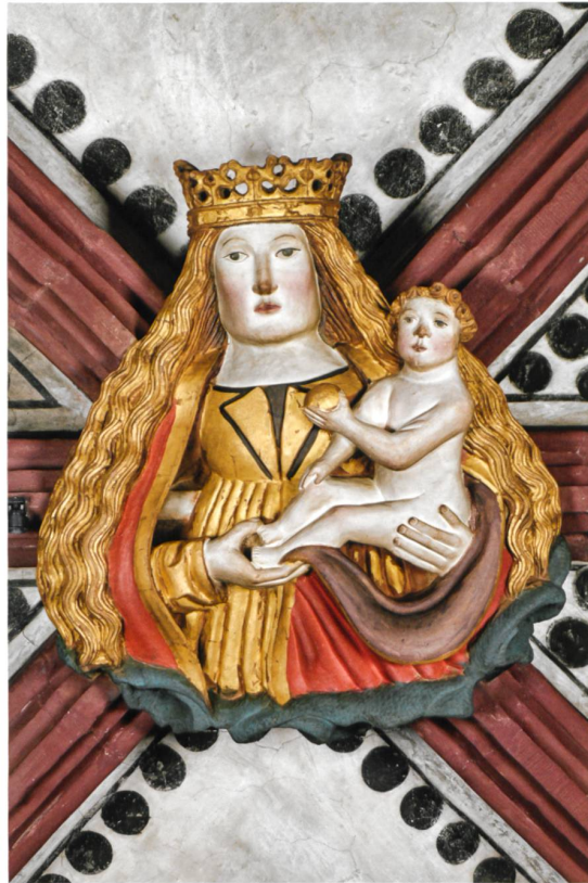
Abb. 5 Hl. Maria mit Kind (Nr. 81).