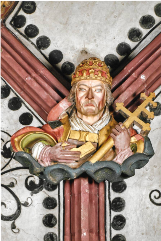
Abb. 4 Hl. Gregor der Grosse (Nr. 57).