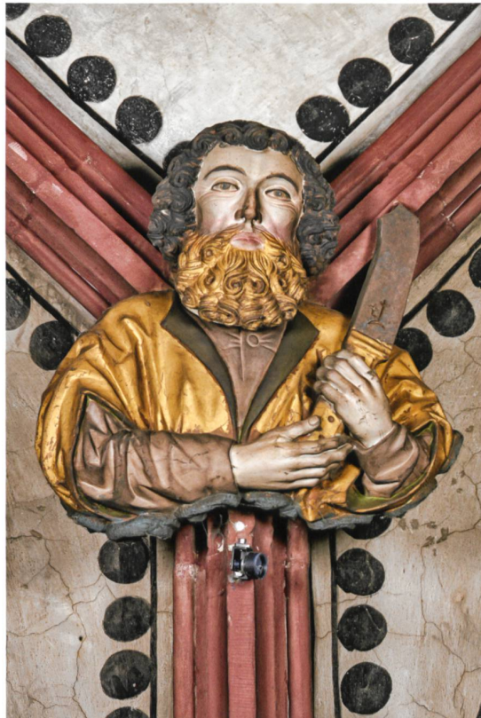
Abb. 3 Hl. Andreas (Nr. 76), Kopf und hinterer Balken des Kreuzes zurückgearbeitet.