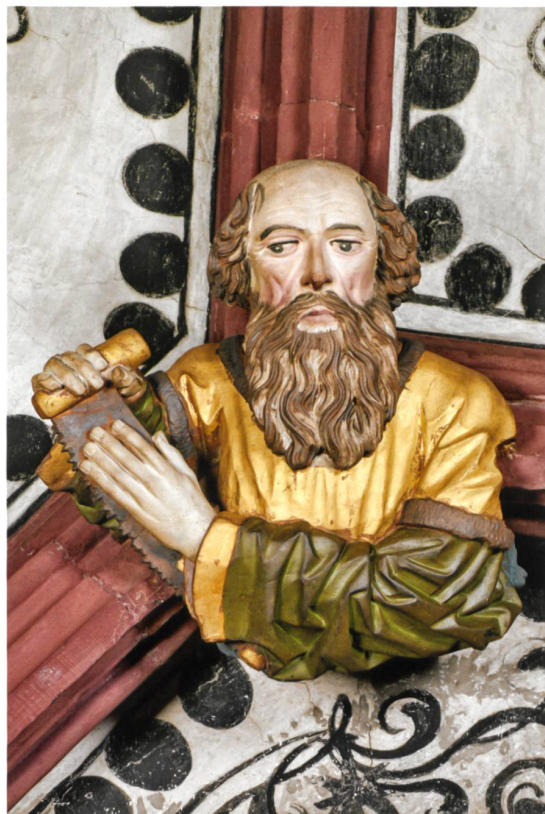
Abb. 7 Hl. Paulus (Nr. 77).