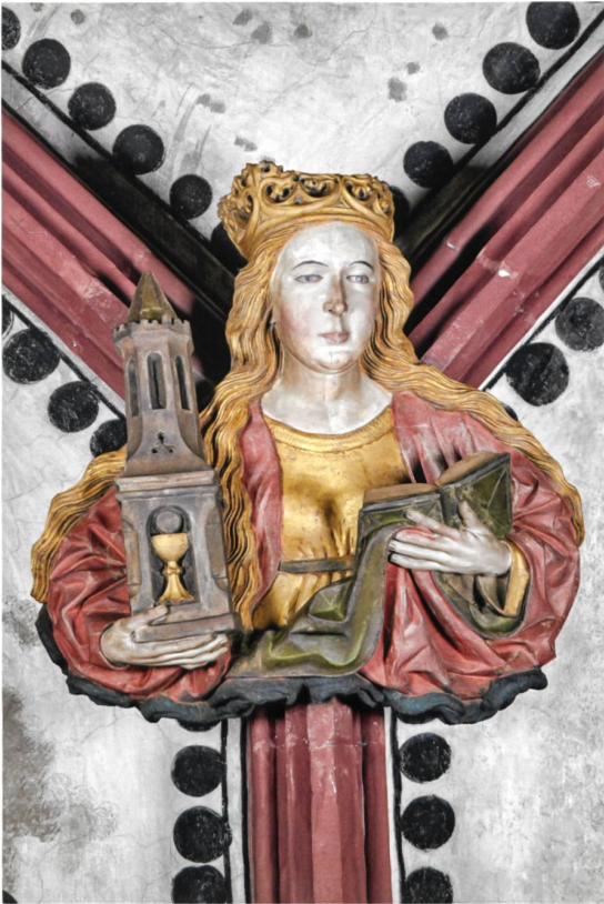
Abb. 8 Hl. Barbara (Nr. 38).