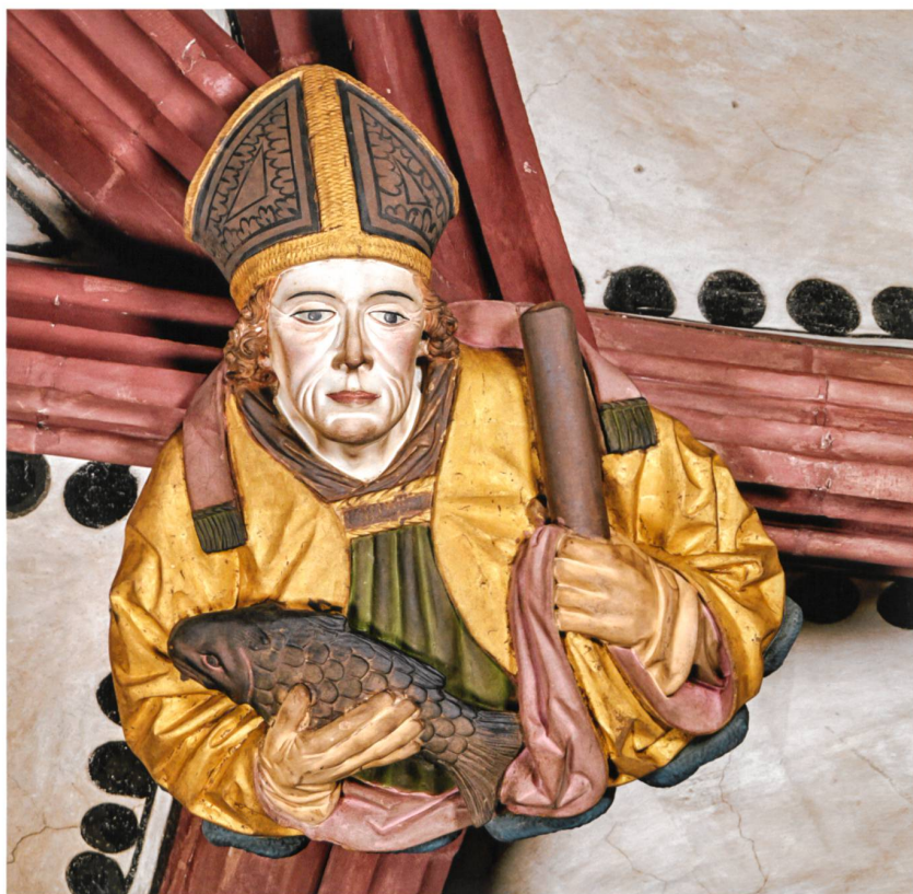
Abb. 10 Hl. Ulrich (Nr. 9).