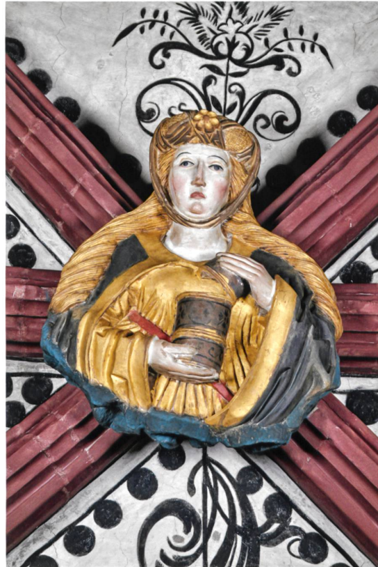
Abb. 9 Hl. Maria Magdalena (Nr. 43).

der spätgotischen Skulptur der Saanestadt keine Vergleichsbeispiele gibt, gehören u.E. ebenfalls zu dieser Gruppe. Es handelt sich um die heiligen Nikolaus und Ulrich im Freiburger Museum für Kunst und Geschichte, 13 wobei Letzterer seinem Namensvetter im Berner Münsterchor (Nr. 9) ausgesprochen ähnlich sieht (Abb. 10 und 11). All diese Skulpturen orientieren sich eindeutig an Werken aus dem Atelier des Würzburger Bildhauers Tilman Riemenschneider. 14