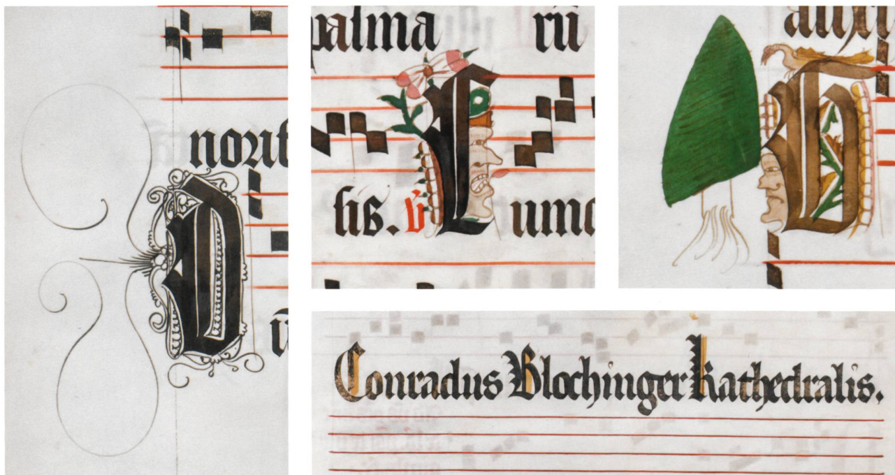
Fig. 6 Cadelures de Conrad Blochinger, Vevey MhV 1347, p. 37