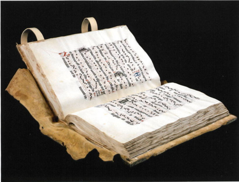
Fig. 2 L'un des antiphonaires, Vevey MhV 1347