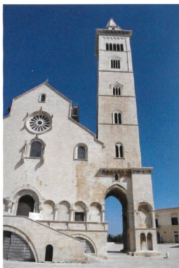
San Nicola Pellegrino