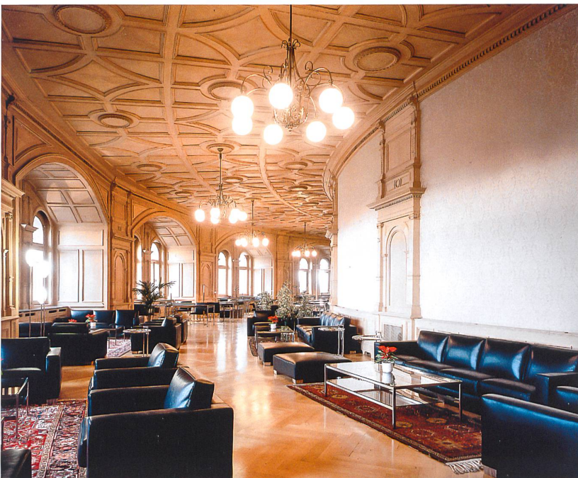
Bibliothek um 1902.