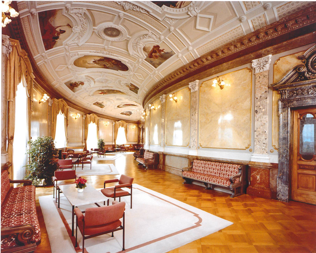
Wandelhalle um 1980, Armlehnstühle und Beistelltisch von Jürg Bally neu in vieux-rosa Stoff bezogen, auch die Wandbänke wurden neu mit einem dunkelrot-weiss gemusterten Stoff bezogen.