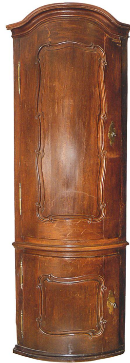
Schrank aus dem Zunfthaus der Spinnwetternzunft von Jakob Ramsperger, 1769, heute im Historischen Museum Basel, Inv.-Nr. 1931.491. Depositum E.E. Zunft zu Spinnwettern.