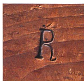
Brandstempel von der Rückwand der Kommode oben. Die ligierten Initialen IR könnten auf Jakob Ramsperger als Hersteller oder als Zwischenhändler hinweisen.