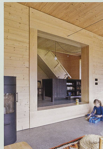
Fig. 3 Vue depuis le séjour de l'appartement du bas, en direction de la cuisine, matérialisée par un bloc aux multiples fonctions, laissant passer le regard au-dessous. Au fond, l'escalier-échelle, comme une citation des Smithson. Seul le sol du rez-de-chaussée fait exception à la règle du tout-bois ; il s'agit d'une chape polie.