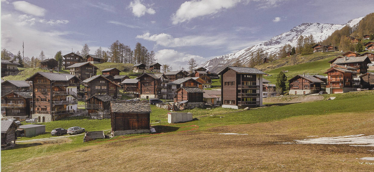
Fig. 2 Faces sud-ouest et sud-est. Le chalet, situé à la jonction entre le village historique sur la gauche et les « nouveaux » chalets isolés des années 1970-1980, sur la droite, dans les hauteurs, agit comme un trait d'union.

local ; excepté le panneautage, il s'agit d'une citation directe de l'escalier-échelle créé par Alison et Peter Smithson, l'apport londonien en somme !