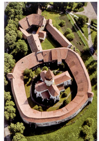
Die Kirchenburg Tartlau.

Melden Sie sich für diese Reise mit dem Talon am Ende des Hefts an, per Telefon 031 308 38 38 oder per E-Mail an: gsk@gsk.ch