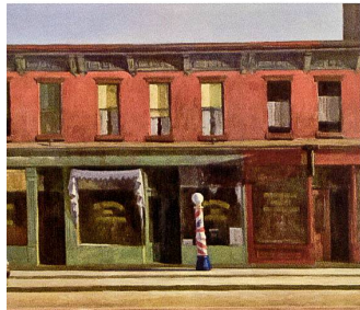
Edward Hopper, Sunday Morning.

Zum Mythos der amerikanischen Kulturmetropole gehört ihre Rolle als Mekka der Weltkunst seit Beginn der Modern Times. Hier entstanden unzählige Werke der amerikanischen Avantgarde; Künstler wie Andy Warhol, Mark Rothko oder Nan Goldin lassen sich ohne die schicksalhafte Verknüpfung mit der Stadt gar nicht denken. Neben der grossen amerikanischen Kunst kam in New York durch ambitionierte Sammlertätigkeit zudem ein transatlantisches Paralleluniversum der europäischen Kunstgeschichte zusammen, das sich in berühmten und opulenten Sammlungen wie Met, MoMA, Guggenheim oder Frick Collection erleben lässt.