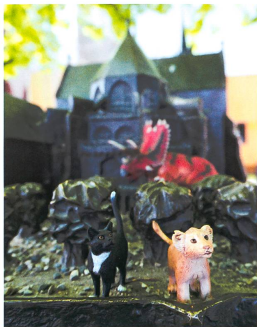
Auf den Spuren von Leo und Lila in Basel. Die faltbare Stadtkarte hilft bei der Orientierung.