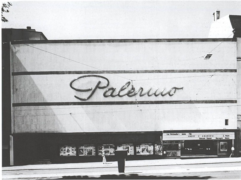
Abb.9a Kino Palermo, Theaterstrasse 4, Basel, Architekten: Suter + Burckhardt, Basel, um 1928. Foto Wolf. Quelle: Staatsarchiv Basel-Stadt, NEG 8018 (Fotoarchiv Wolf)