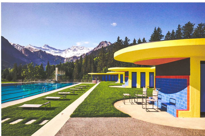
Seit 2019 erstrahlt es wieder in altem Glanz vor beeindruckender Alpenkulisse: das Freibad von Beda Hefti in Adelboden.

Mit dem Geist der Erneuerung ging auch eine Veränderung in der Wahrnehmung und Vermittlung des Bildes der Alpen einher: Verschwunden sind die alten Klischees der Bergwelt wie Enzian und Alpenrosen, vermarktet wird ein neues Lebensgefühl – basierend auf Bewegung, Vergnügen und Genuss. Der moderne Körper ist ein sportlicher Körper. Der expressive Sprungturm in