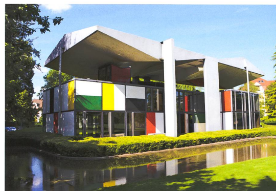
Von oben nach unten: Die Krypten des Basler Münsters, La Maison Rose in Siders, Corbusier-Pavillon in Zürich.