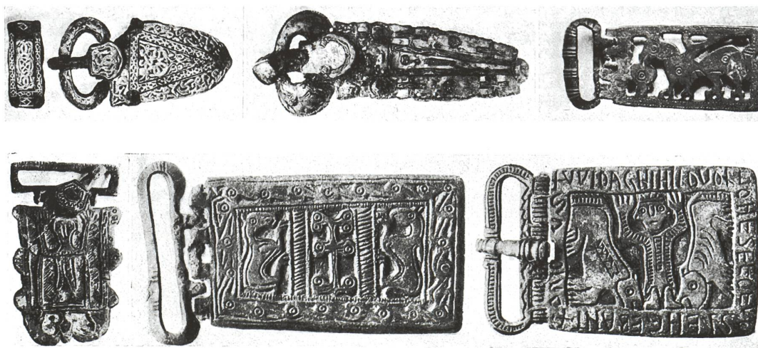
Fig. 1 et 2 Joseph Gantner, Histoire de l'art en Suisse , 1 : Des origines à la fin de l'époque romane, pp.75 et 76, Neuchâtel, 1941

Pour les historiens de l'art préoccupés d'ancrer cette production régionale, éventuellement nationale, dans les grands courants artistiques européens, le haut Moyen Âge n'a pas, à proprement parler, d'existence sinon celle d'être une période coïncée entre deux floraisons à haute valeur ajoutée, l'Antiquité et le Moyen Âge. Au mieux, cet âge « sombre » est donc une phase de transition, avec ses hoquets, ses retards, ses accélérations. De plus, la culture matérielle qu'il a produite est perçue par eux comme la résultante conflictuelle de la rencontre houleuse du classicisme antique et de l'abstraction nomade. Un exemple devrait suffire. Dans son Histoire de l'art en Suisse (1941) 2 , Joseph Gantner oppose ainsi le caractère immatériel et