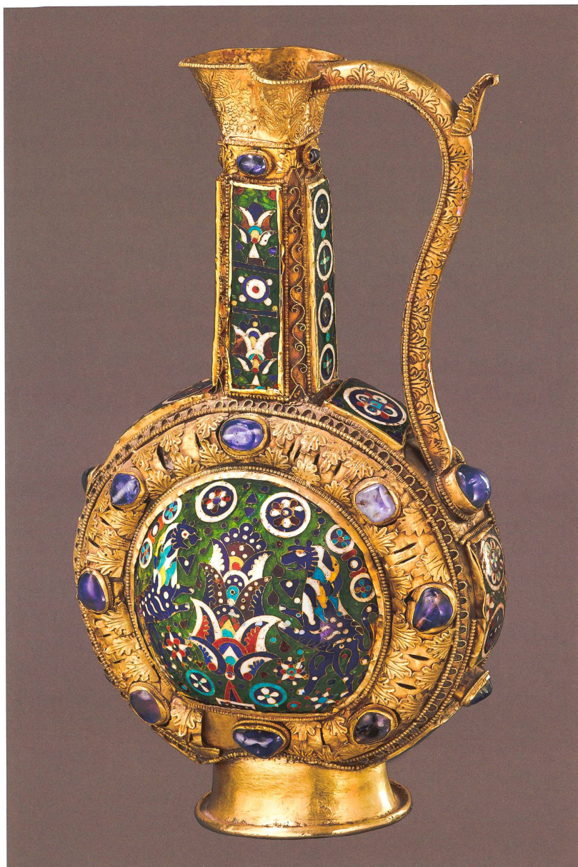
Fig. 8 Aiguière dite de Charlemagne, Atelier carolingien (Aix-la-Chapelle?), 1 ère moitié du IX e siècle? (Trésor de l'Abbaye de Saint-Maurice, inv. 6). H : 30,6 cm ; L : 11,3 cm ; Ø (pied) : 11,3 cm.

Sion Sous-le-Scex Est, le repérage en fouille de déchets de production de verre témoigne ainsi non seulement de la présence d'un atelier fonctionnel entre la fin du V e et le début du VI e siècle, mais également de la continuité de la pratique qui consiste à recycler le verre ancien pour en fabriquer du nouveau, principalement comme agent colorant 8 .