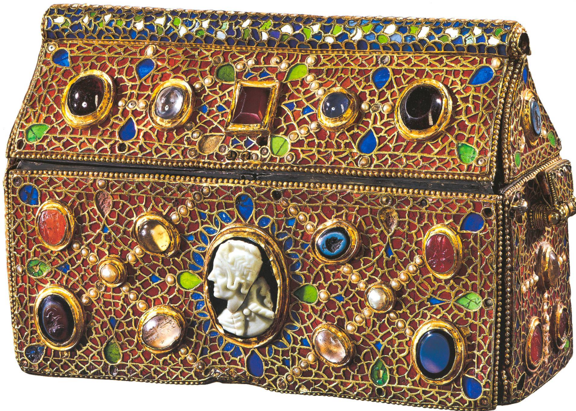
Fig.3 Coffret de Teudéric, sud-ouest de l'Allemagne ?, 1 ère moitié du VII e siècle ? (Trésor de l'Abbaye de Saint-Maurice, inv.5). H : 12,5 cm ; L : 19 cm ; l : 6,5 cm.

abstrait, la simplification « barbare » à la pondération organique des formes chère à l'esprit antique. C'est un facteur exogène, qualifié d'inorganique et d'ornemental poursuit l'auteur, qui signale une opposition consciente à l'art classique où la représentation humaine est centrale. Passée la collision frontale de ces deux cultures que tout oppose, il dévoile ce qui lui semble une progressive reconquête de la figure humaine, qu'il débusque dans l'étude de l'évolution du décor des plaques-boucles (fig. 1 et 2) et qu'il nomme « la succession typologique, qui va de l'ornement pur à la représentation figurale » 3 . Le modèle herméneutique mis en avant par Gantner, soutenu par une explication psychologique, repose donc sur une prétendue loi de l'évolution des styles, selon laquelle on passerait d'une forme archaïque simple à des compositions complexes et raffinées au sein desquelles la représentation humaine figure naturellement un sommet. L'évolution s'achève au IX e siècle avec les Carolingiens, alors que la composante barbare se résorbe définitivement. On comprend les limitations d'une telle approche : dès lors que l'on postule un progrès dans les arts, l'histoire comparatiste ne peut que conclure à des « retards stylistiques » et faire surgir de nombreux anachronismes artistiques, appelés à coexister au sein d'espaces partagés. Le raisonnement en termes de centre et périphérie s'applique ici de manière