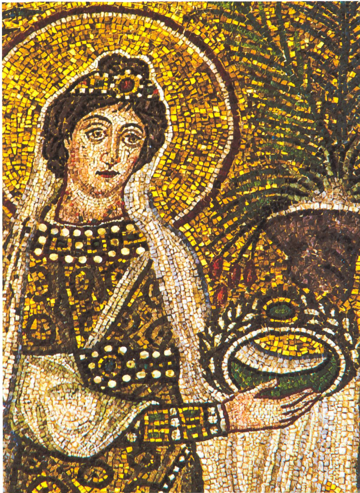
Fig. 8 Mosaïque de la basilique Saint-Apollinaire-le-Neuf à Ravenne. Détail de la procession des vierges. Tiré de P. Porta, in A. Carile (dir.), Dall'età bizantina all'età ottoniana, volume 2.1 , Venezia, 1991, XCVII-C, photo P. Zappaterra

supposée des perles de La Tour-de-Peilz, des analyses physico-chimiques ont été effectuées sur trois exemplaires retrouvés dans les sépultures T143, T170 et T481.