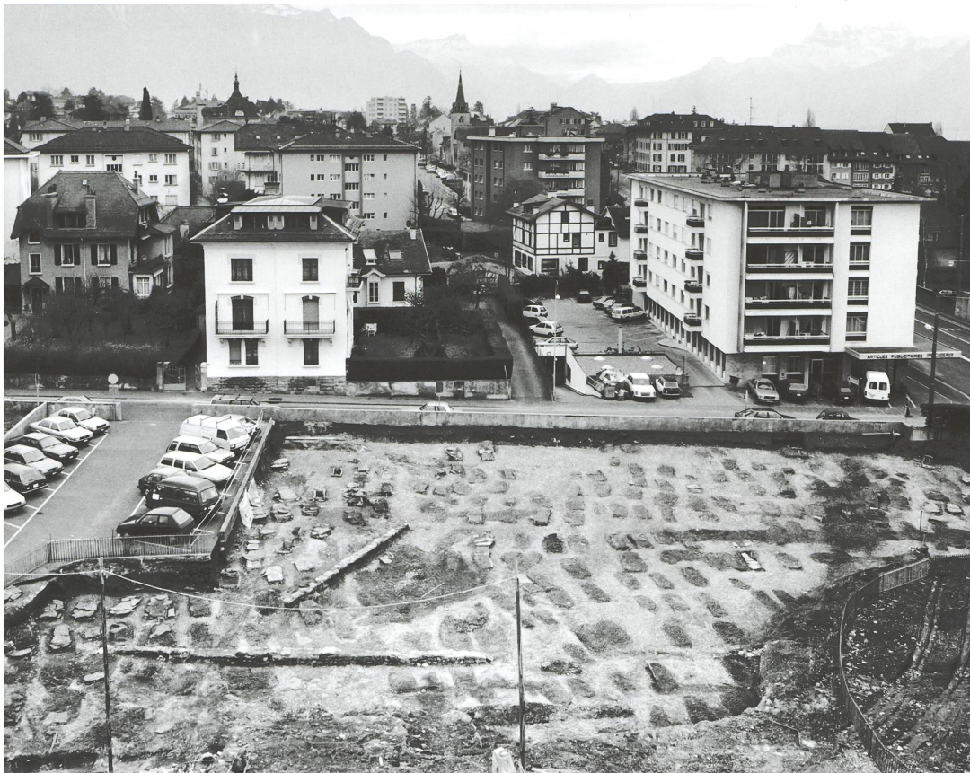
Fig.2 Vue générale du cimetière du Clos d'Aubonne à La Tour-de-Peilz (VD) lors des fouilles de 1988-1989, en direction de l'est.

ou un galon bordant un voile destiné à retenir la chevelure 1 . La coiffe de la reine mérovingienne Arégonde, morte en 580, dont la riche sépulture a été mise au jour dans la basilique Saint-Denis près de Paris, constitue un bel exemple de l'aspect que pouvait revêtir celle de La Tour-de-Peilz. La reine Arégonde portait un bandeau brodé de fils d'or qui enserrait ses cheveux recouverts d'un long voile de soie de couleur jaune et rouge (fig. 4) 2 .