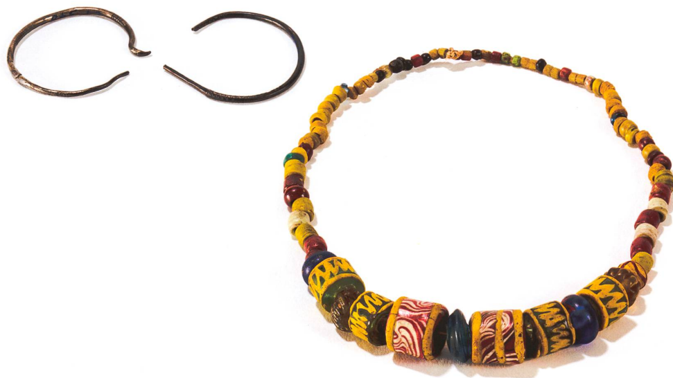
Fig. 1 Collier de perles en verre de la tombe 166B de Lausanne, Bel-Air (VD). Dernier tiers du VI e -premier tiers du VII e siècle.

L'une de ces quatre sépultures (T 137) a livré, près du crâne, des filaments d'or formant des replis, associés à un minuscule prisme en cristal de roche (fig. 3). À l'image d'autres découvertes faites dans les régions rhénanes et au nord de la Gaule, où des éléments de parure identiques ont été découverts dans la même position par rapport au squelette, mais en association avec des restes de tissus, les fils d'or de La Tour-de-Peilz ont pu être interprétés comme des ornements brodés sur un bandeau