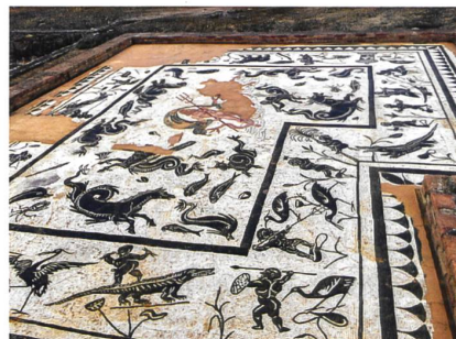
Römisches Mosaik in Itálica.