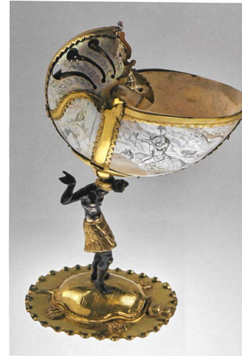
Frank Christian, Nautiluspokal, um 1680 , Ville de Genève, Musées d'art et d'histoire, Schenkung Anne-Catherine Trembley an die Bibliothèque publique de Genève, 1730, G 0937.

Mehr Informationen zum Projekt und zur Ausstellung unter www.theexotic.ch