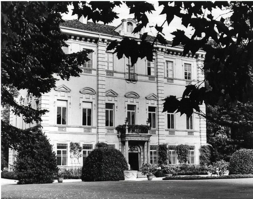
Abb. 1 Vigna di Madama Reale, Turin, um 1980.