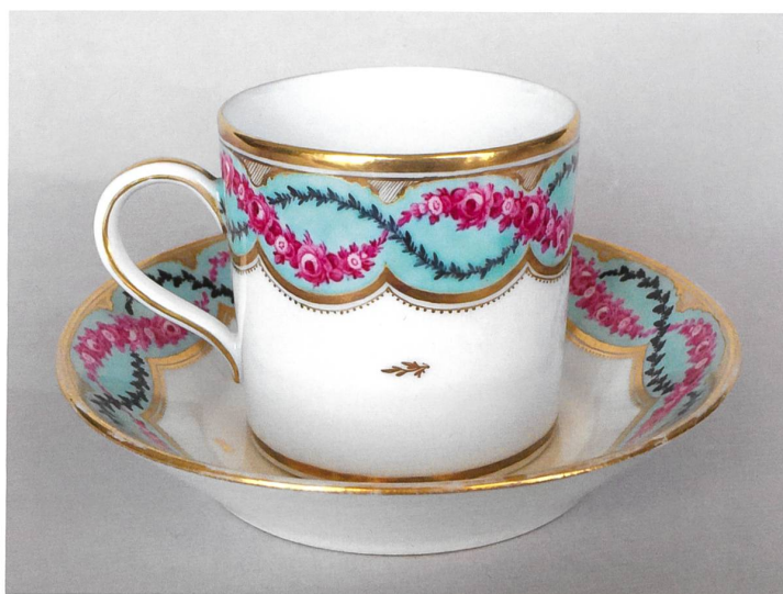
Fig. 11 Bol à bouillon (H. 10,5 cm, L. 16,8 cm) et présentoir (D. 18 cm), vers 1790, à décor de guirlandes florales et or, rang de motifs arrondis entre galons, filet pointillé et chutes or d'une rare finesse. Vendu 250 francs chez Koller à Zurich le 23 septembre 2018, lot 8439. Coll. part.