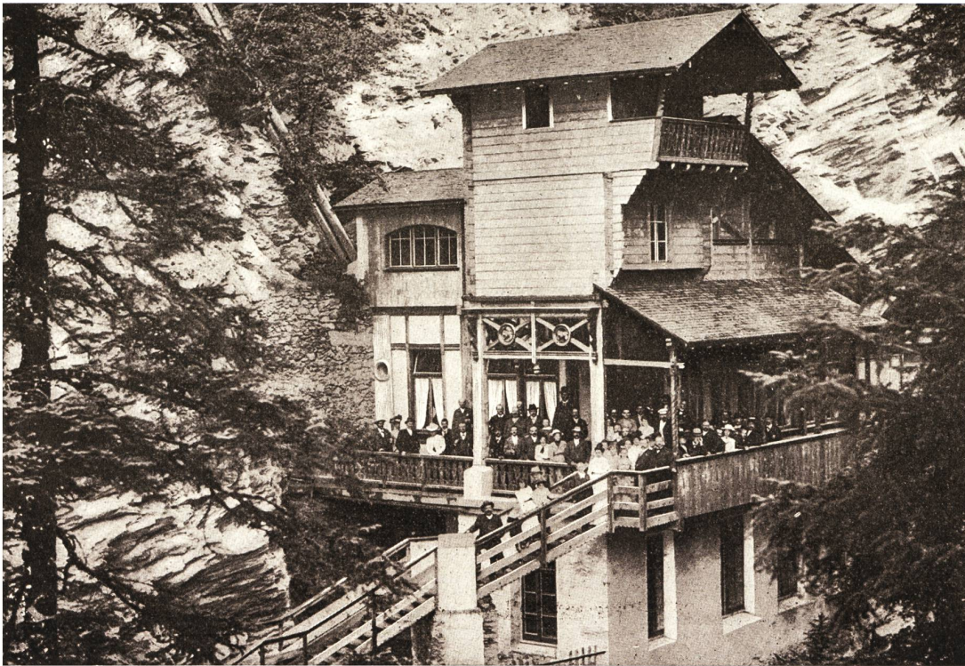
Abb. 3 «Quellengebäude und Trinkhalle in der Rabiusschlucht», Passugg Mineralquellen, Bad- und Kurhaus mit Dépendance. Werbebrochure, um 1905