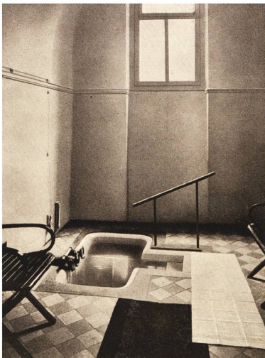
Abb. 5 Elektrisches Bad, Hydro-elektrotherapeutische Anstalt Grand Hôtel des Bains in Aigle Kanton Waadt (Schweiz). Werbebrochure, 1883, S. 11