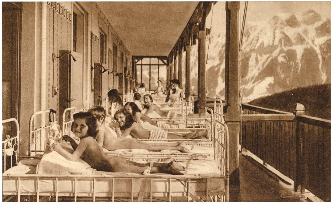
Abb. 9 «Eine Sonnenkur-gallerie in ‹Les Frênes›», Die Sonnenkur in den Kliniken von Dr. Rollier in Leysin (Schweiz) . Werbebroschüre, um 1920, S. 14

Ernährung mit sechs Mahlzeiten pro Tag und Wasseranwendungen, wie Duschen und Abreibungen. Die Sanatorien waren wie Hotels eingerichtet, mit eleganten Speisesälen, Bibliotheken und Musikzimmern. Die meisten verfügten aber auch über medizinische Infrastruktur, wie einen Operationsaal, ein Laboratorium und ein Röntgenkabinett. Seit der Entdeckung des Tuberkelbazillus wurde in den Sanatorien viel Wert auf Desinfektion gelegt. In den Broschüren werden Linoleumböden, abwaschbare Oberflächen und desinfizierende Spüleinrichtungen für das Geschirr erwähnt. Der ungehinderte Zutritt von Luft und Licht wurde durch grosse, gegen Süden gerichtete Fenster mit Ventilationsklappen ermöglicht. Im Sanatorium Seehof in Davos werden gar «durch Glaswände voneinander getrennte Privatliegehallen» 5 erwähnt, die an Trennwände aus Plexiglas erinnern, die heute zur Vermeidung einer Ansteckung mit Covid-19 allgegenwärtig sind.