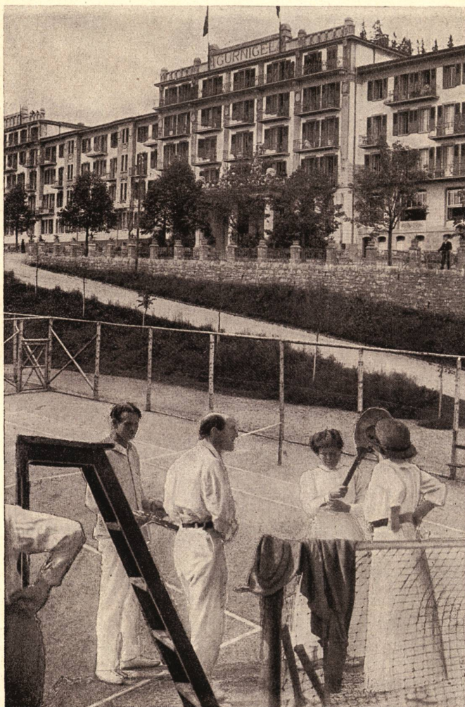
Auf dem Tennisplatz

Abb. 2 «Auf dem Tennisplatz», Bad & Kuranstalten Gurnigel bei Bern . Werbebroschüre, undatiert, S. 9