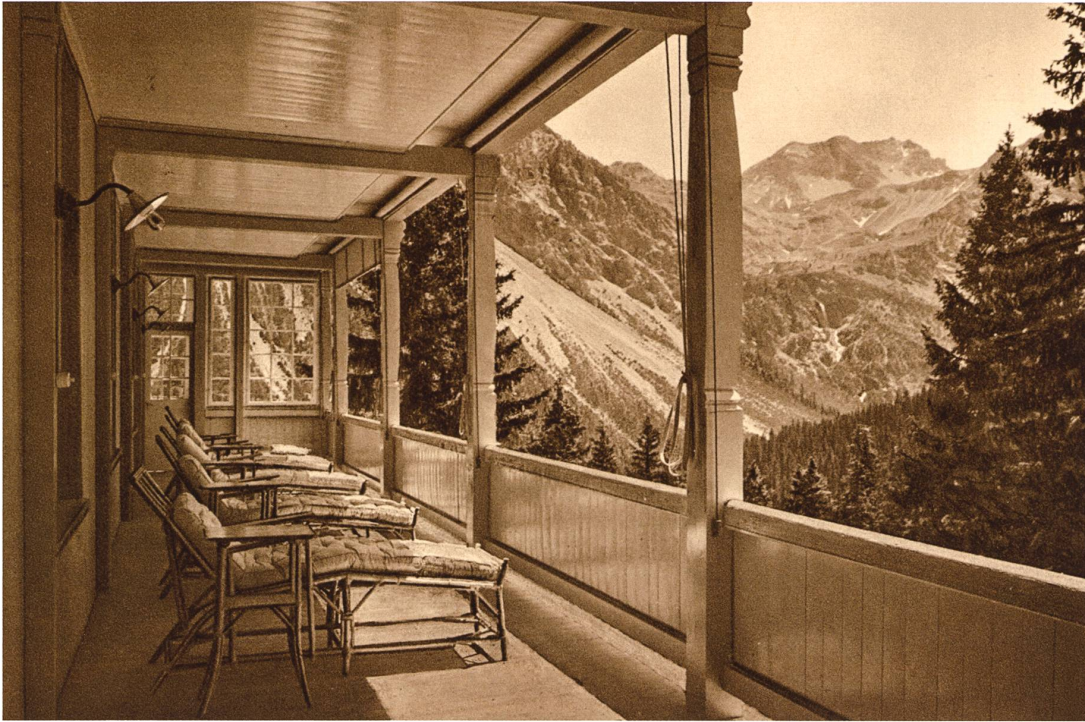
Abb. 8 «Allgemeine Liegehalle», Parksanatorium Arosa . Werbebroschüre, undatiert, keine Paginierung

als ansteckend gefürchteten Tuberkulosekranken keine Aufnahme finden würden.