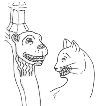
Dieser Löwe befindet sich an der Trennwand zwischen zwei Sitzen.

«Nein, du Holzkopf!», ruft Lila. «Weil wir Mäuse jagen, die dann den Menschen den Käse nicht wegfressen!» ●