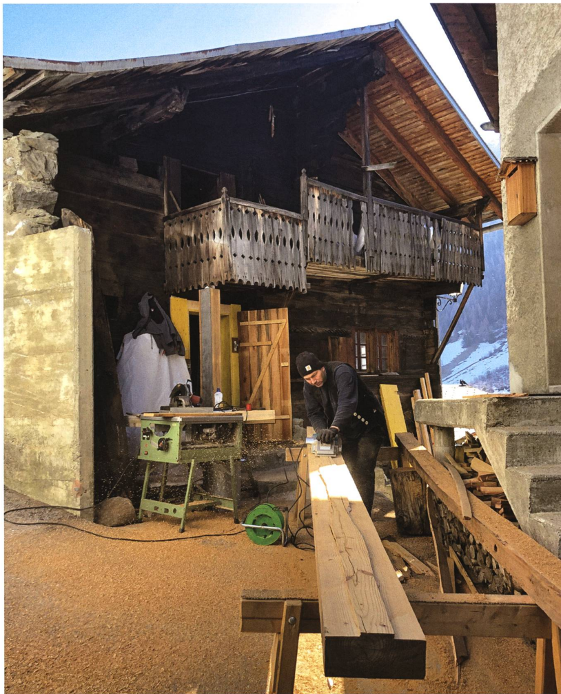
Das «Anselmhuis» von 1556 mitten im engen Dorfgefüge von Ferden VS. Seine Sanierung verdeutlicht den Wert des Handwerks und den zeitgemässen Umgang mit traditionellen Konstruktionen im Alpenraum.