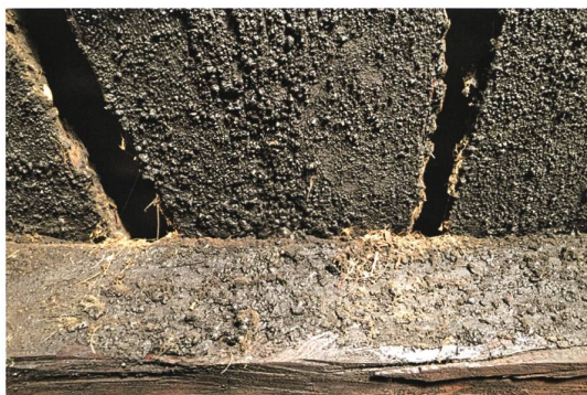
Abschaben der Russchichten.