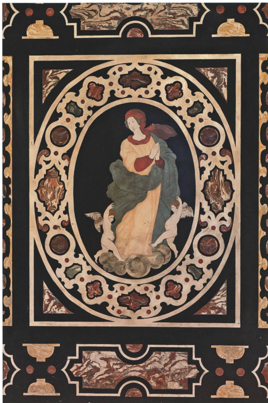
Fig. 2 Lugano, chiesa di Santa Maria degli Angeli, dettaglio della raffigurazione centrale del paliotto dell'Assunta.