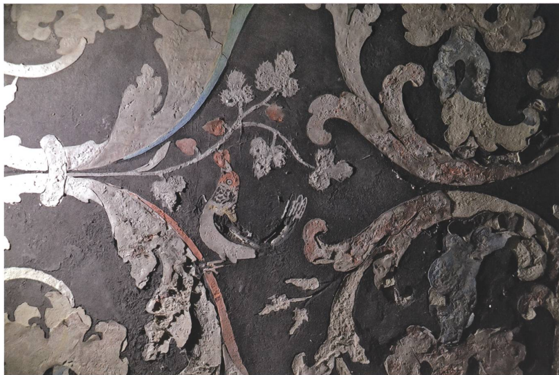
Fig. 13 Brissago-Taja, oratorio della Vergine di Montenero, paliotto con mazzo di fiori. È visibile un degrado avanzato della superficie affetta da esfoliazione, disgregazione e caduta delle decorazioni intarsiate.

soprattutto a carico del cinabro che, invece di presentarsi rosso vivo, si trasforma in varie tonalità che vanno dal grigio chiaro fino al bruno (fig. 12).