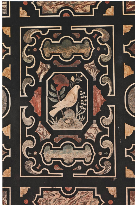
Fig. 3 Lugano, chiesa di Santa Maria degli Angeli, dettaglio della lastra laterale del paliotto dell'Assunta.

rella o con l'immagine della Madonna, circondata da filetti intrecciati, racemi, fiori, frutti e uccelli dai sorprendenti colori, realizzati secondo schemi compositivi ricorrenti e ripetuti in diverse opere (fig. 2 e 3). La diffusione sul territorio di questi paliotti si inserisce nel gusto decorativo settecentesco per i marmi policromi, che vede la commissione di imponenti altari maggiori e balaustre concepiti per arricchire la zona presbiteriale e le cappelle laterali (si ricordano, ad esempio, l'altare maggiore della chiesa di Santa Maria del Sasso a Morcote, gli altari della Collegiata di Bellinzona, quelli della parrocchiale di Arzo e di Ligornetto) (fig. 4). Queste opere vengono realizzate da botteghe legate alla tradizionale lavorazione del marmo, accostando pietre locali, in particolare quelle provenienti da Arzo (nelle varietà Macchiavecchia, Rosso e Broccatello), il Nero di Varenna, marmi provenienti dalle Alpi Apuane (come il Fior di Pesco, il bianco di Carrara, il Bardiglio), il Giallo Verona e gli arabescati provenienti dalle Orobie. All'interno di questa produzione artistica, le scagliole hanno goduto di un grande successo perché miscelando pochi e semplici ingredienti – come gesso, acqua di colla e pigmenti – permettevano di ottenere superfici lisce e compatte che potevano essere lucidate, per avere un aspetto simile al