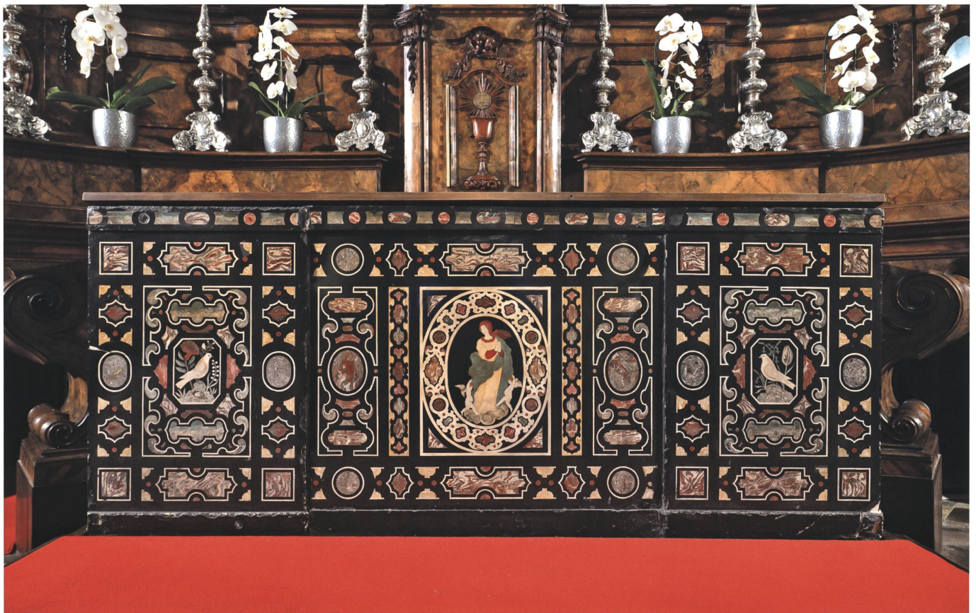
Fig.1 Lugano, chiesa di Santa Maria degli Angeli, paliotto dell'Assunta collocato presso l'altare maggiore.

In Ticino i paliotti sono a lastra unica o tripartita, quasi sempre su fondo nero, in modo da dare maggior risalto agli intarsi colorati (fig. 1). 2 Al centro delle lastre è sempre posta una medaglia con la raffigurazione del Santo a cui è dedicata la cap-