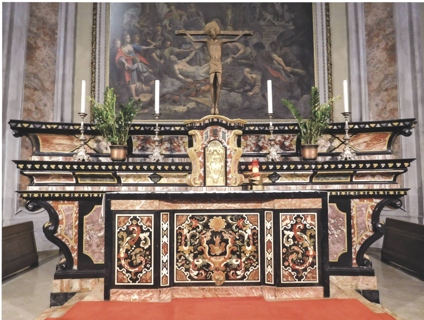
Fig.4 Ligornetto, chiesa di San Lorenzo, paliotto dell'altare maggiore. Il paliotto in scagliola si inserisce qui in un fastoso altare in marmo.

alla loro conservazione, in modo da promuovere azioni preventive per la tutela e non solo interventi a danno avvenuto. 4