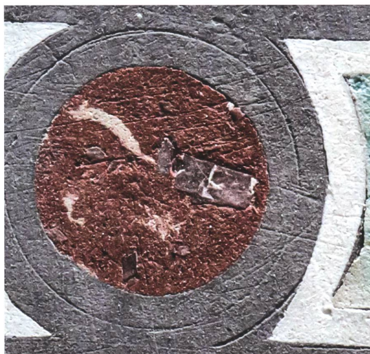
Fig. 11 Bedigliora, chiesa di San Salvatore, dettaglio del paliotto delle Anime purganti. L'artista ha dimenticato di scavare una delle cornici che racchiudono i tondi a finto marmo.