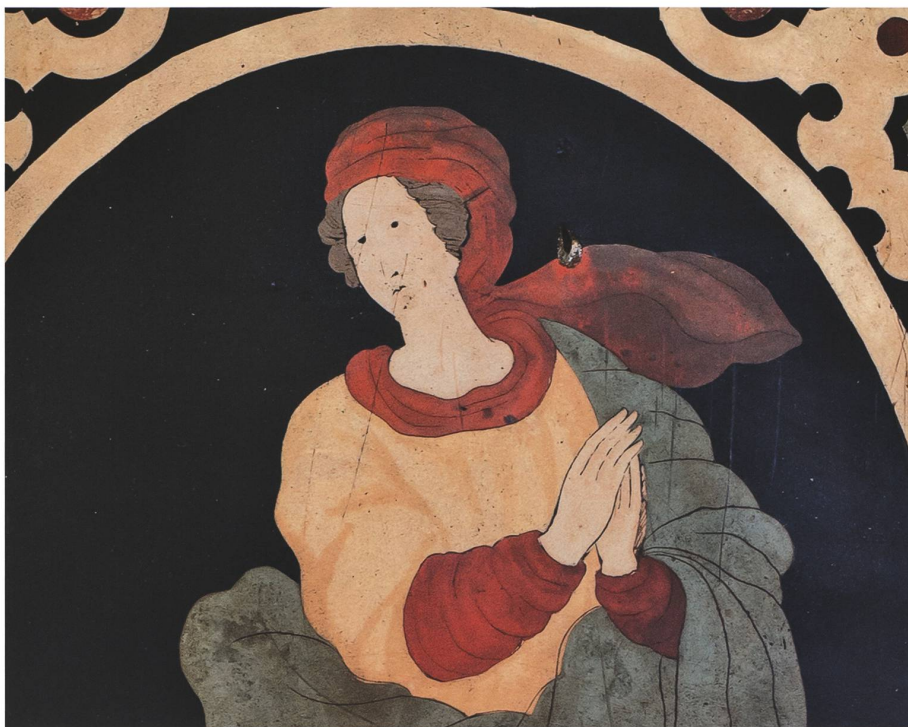
Fig. 12 Lugano, chiesa di Santa Maria degli Angeli, paliotto dell'altare maggiore, dettaglio del velo dell'Assunta che presenta un'alterazione cromatica del pigmento rosso che tende al nero.

è stato identificato principalmente l'orpimento, usato puro per ottenere meschie gialle e miscelato con indaco per ottenere i toni verdi. 10 L'ocra gialla, nonostante fosse molto più economica e facilmente reperibile, è stata trovata solo nel paliotto dell'antico ossario della parrocchia di San Vittore a Muralto. Tra i pigmenti rossi è stato individuato principalmente il cinabro, il vermiglione (cinabro artificiale) e, solo una volta, l'ocra rossa. Non avendo condotto analisi volte a identificare la componente organica delle meschie non si può escludere l'utilizzo di coloranti rossi, in quanto su opere carpigiane è stata accertata la presenza della robbia. 11 Nelle meschie verdi è stata identificata la terra verde, la malachite e, come già accennato, un verde ottenuto mescolando orpimento e indaco. Tra i blu sono stati utilizzati il blu di smalto, l'azzurrite, l'azzurrite artificiale (blu verditer, blu bice) e il blu di Prussia (quest'ultimo su opere posteriori agli anni '70 del Settecento). È interessante notare che tutti questi pigmenti sono gli stessi indicati nel manoscritto seicentesco del Pozzuoli. 12 In letteratura vengono citate anche meschie che contengono frammenti di pietre, marmo, vetro o inserti madreperlacei probabilmente confusi con frammenti di selenite, unico tipo di minerale identificato nel corso di questa ricerca.