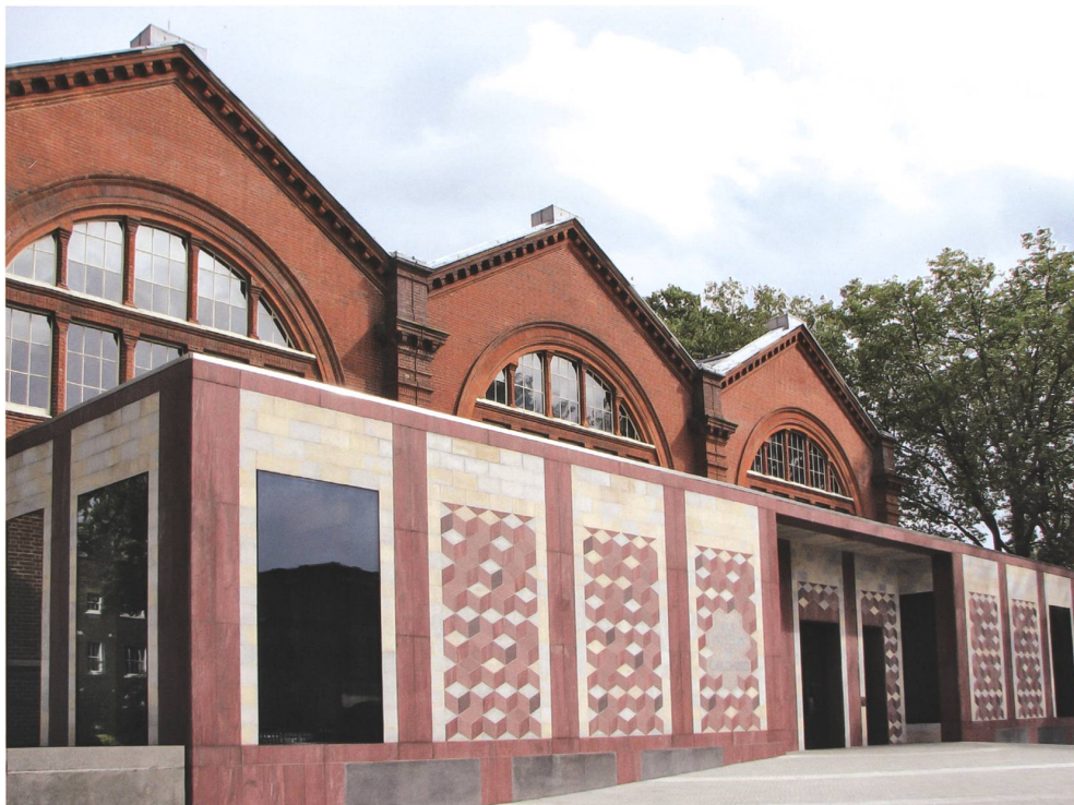
Abb. 6 Museum of Childhood, London, Caruso St John Architects, 2002–2007.

Grossbritanniens verweisen und aus ehemaligen Kolonien stammen (Abb. 6). Allerdings liessen sie die Steine in sehr dünne Platten schneiden und wie Fassadenfliesen verbauen, ein optischer Bruch, der die dem Stein eigene Massivität negiert und auf die veränderten politischen und ökonomischen Verhältnisse verweist.