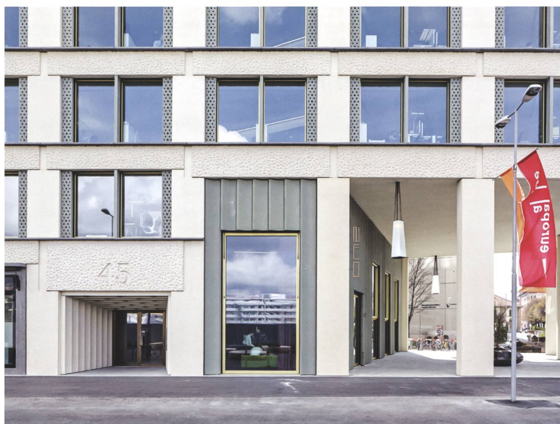
Abb. 7 Wohn- und Geschäftshaus Europapallean, Zürich, Caruso St John Architects, 2007–2013.

künstlichen Anmutung dieses natürlichen Materials und setzen sowohl im Aussen- wie auch im Innenraum Konglomeratgesteine ein (Abb. 8). Die durch Kunststeinbänder gegliederte Aussenfassade ist mit Platten aus Brannenburger Nagelfluh verkleidet, einer Natursteinart aus der Region südlich von Rosenheim, die optisch wie geschliffener Waschbeton erscheint. 9 Die Küchenarbeitsplatten in den Wohnungen wurden aus poliertem Marinace Verde, einem brasilianischen Naturstein, gefertigt und wirken wie ein hochwertiger Kunst-