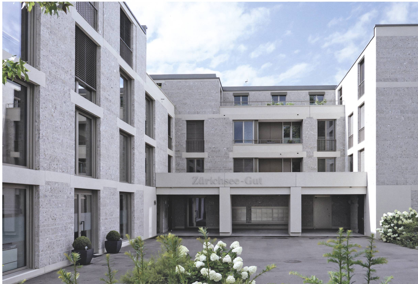
Abb.8 Zürichsee-Gut, Stäfa, Meier Hug Architekten, 2014–2017.

stein in Terrazzooptik. Die dunklen Bodenplatten im Treppenhaus indes, die eigens aus regionalen Konglomeratfindlingen gesägt wurden, sind von Kunststein nicht zu unterscheiden.