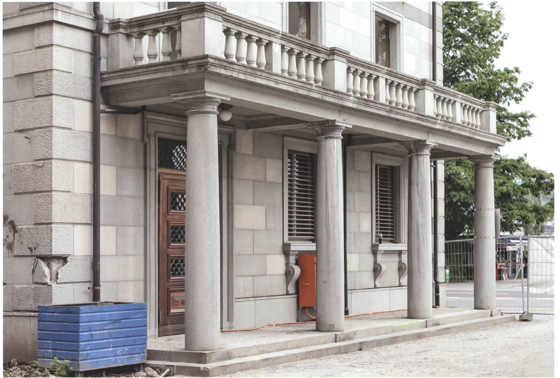
Abb.5 Kunststeinkonsole des Mythenschlosses.