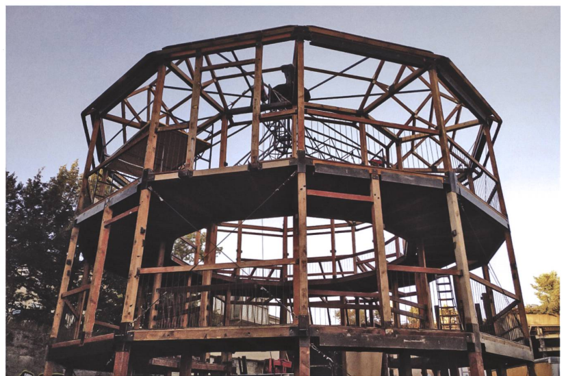
La Tour Vagabonde, construite en 1996 par le collectif fribourgeois des Ateliers de l'Orme, représente cinquante tonnes de matériel (bois, métal, bâche).

La Tour Vagabonde peut être montée selon deux configurations: soit en café-théâtre avec des tables et des chaises dans les étages et une capacité de 120 places assises, un bar et une scène de 4 mètres sur 4, soit en théâtre avec des gradins pouvant accueillir entre 250 et 300 personnes assises et une scène de 6 mètres sur 8. Le fût constitue l'élément central pour la construction de la Tour. Il s'agit d'un dodécagone entouré sur l'avant des rampes d'escalier qui donnent accès aux différents étages et flanqué d'escaliers de secours et d'une annexe (loges) sur l'arrière. La stabilité de l'édifice est assurée seulement lorsque que tous éléments sont montés, car il n'a pas d'ancrage au sol et le