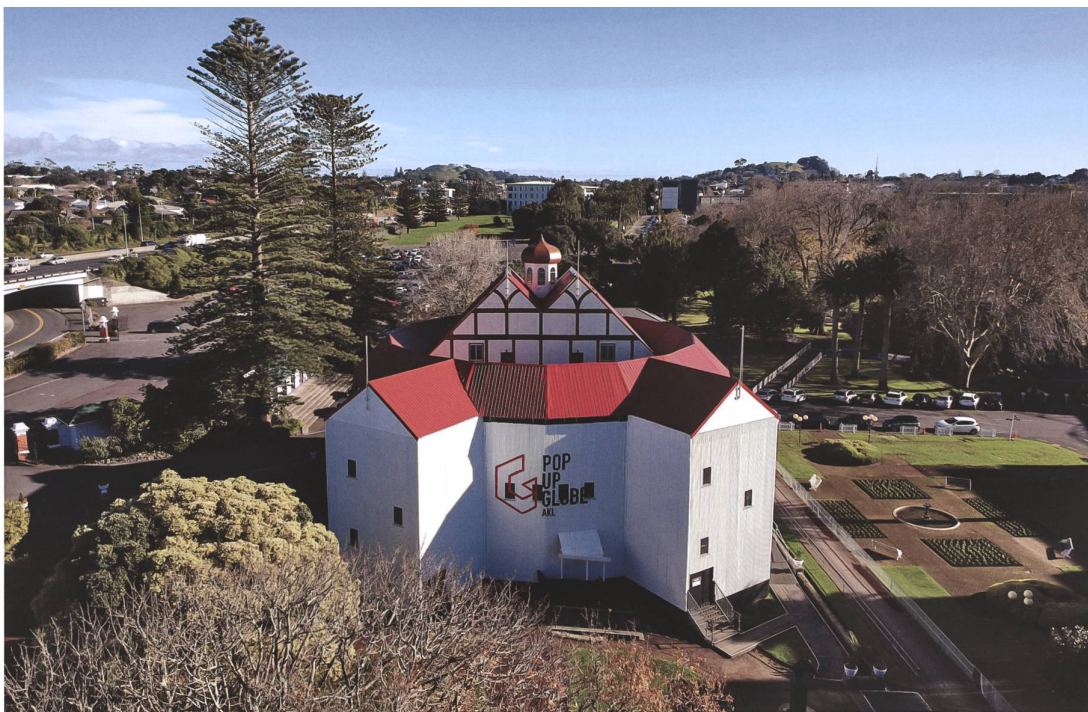
Le Pop-Up Globe à Auckland, Nouvelle Zélande, inauguré en 2016.

une scène itinérante et innovante. En 2006, les constructeurs des Ateliers de l'Orme se mettent à la recherche de la Tour et la découvrent abandonnée dans les alentours de Sion et en très mauvais état. Tout comme le Globe au XVII e siècle, la Tour commence sa seconde vie après de grands travaux de restauration et la création de la Fondation de la Tour Vagabonde, basée à Ferpicloz, dans la campagne fribourgeoise.