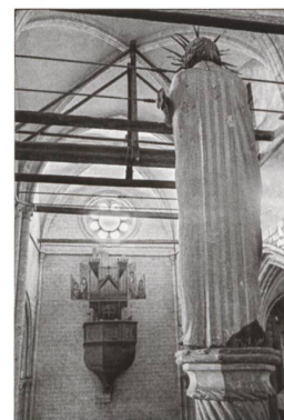
Pignon occidental. La rose polylobée après sa réouverture en 2002.