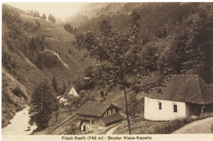
Flüeli-Ranft (748 m) - Bruder Klaus-Kapelle