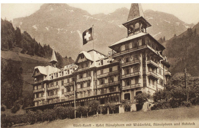
Flüeli-Ranft - Hotel Nünalphorn mit Widderfeld, Nünalphorn und Hutstock

der Gäste in den Fichtennadel-, Kohlensäure- oder Solbädern kümmerte sich laut Werbung sogar ein eigener Kurarzt. Für das geistliche Wohl der Gäste wurden katholische und evangelische Gottesdienste angeboten. In der Umgebung konnten sie Cricket und Tennis spielen und auf den von Hotelier Hess angelegten Pfaden promenieren. Etliche Früchte und Gemüse kamen aus der eigenen Landwirtschaft neben dem Haus. Mit der Kutsche und später mit dem Postauto konnten die Gäste sogar Ausflüge in die weitere Innerschweiz sowie an den Vierwaldstättersee oder zum Brienersee unternehmen. 7