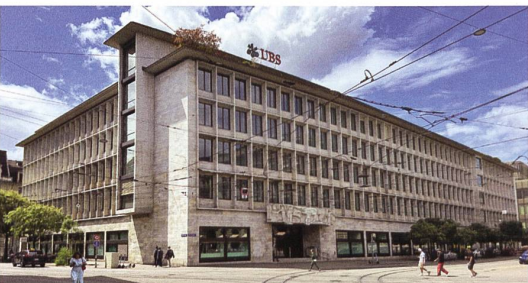
Zürich → 47