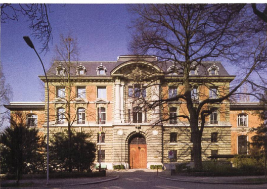
Bern → 22