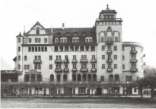
Interlaken → 5