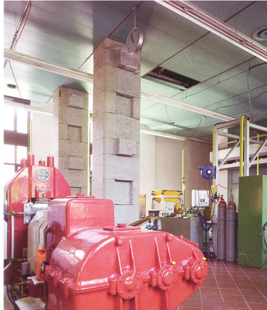
Das Zusammenspiel von Sandstein, Kalkstein, Gneis und Backstein erzeugt das aussergewöhnliche Fassadenbild der Swissmint, hier an der Ecke Aegertenstrasse/ Kirchenfeldstrasse (links). Auch im Maschinensaal im Erdgeschoss (rechts) treten zwei Säulen aus Tessiner-Gneis-Quadern markant in Erscheinung.

kamins auf der Südseite – nahm am 1. September 1855 die Eidgenössische Münzprägestätte den Betrieb auf. Als Zeichen der neuen Hoheit wurde in den Segmentbogen über dem Eingangstor ein Schweizerwappen aufgemalt. Ausser Münzen und Medaillen wurden in den Produktionsstätten auch Teile der Postwertzeichenherstellung ausgeführt: das Perforieren, Schneiden und Gummieren der Marken. Zudem wurden Teile der Eidgenössischen Eichstätte in der Münz untergebracht. In den Folgejahren versuchte der Bund das Grundstück vom Kanton zu übernehmen, was 1891 auch gelang. Für die Bundesverwaltung war die Umnutzung des alten Baus allerdings nicht ideal – man hielt Ausschau nach neuen Standorten und konnte schliesslich 1901 in den Räten den Landkauf im Kirchenfeldquartier verabschieden.