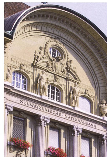
Blick auf die Hauptfassade West der Schweizerischen Nationalbank. 1919 war der Bundesplatz als Bankenplatz komplett.

Nach der Gründung der Nationalbank im Oktober 1905 mietete diese zunächst Räumlichkeiten an der Bundesgasse 8 – heute das Medienhaus des Bundes –, die der Bund zur Verfügung stellte. Auf der Suche nach einem geeigneten Standort für den Bau des Berner Hauptsitzes der Schweizerischen Nationalbank konnte die Bank 1907 die Hälfte des Bürki-Areals übernehmen. Der Bund, der dieses Bauland durch Enteignung an sich gebracht hatte, wollte der Bank jedoch nur den zum Platz hin orientierten Teil überlassen. Auf der Rückseite plante er den Bau eines weiteren Verwaltungsbaus, des heutigen Bundeshauses Nord.