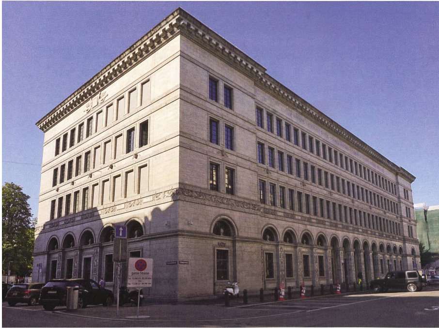
Der Nationalbanksitz in Zürich, ein Solitär an der Bahnhofstrasse zum Bürkliplatz hin.