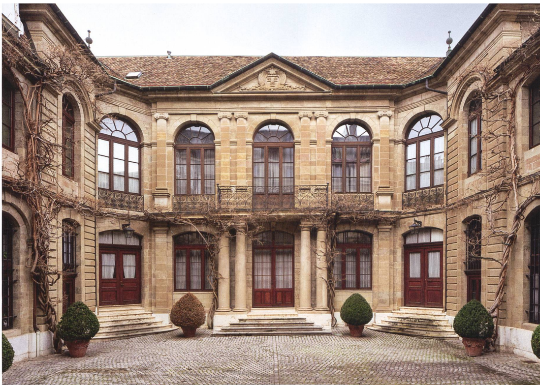
Rue Calvin 13. Hôtel Buisson. Vue des façades sur la cour.

résidentielles de l'élite genevoise, notamment l'implantation des grandes maisons et le choix de localisations privilégiées, l'adaptation à la trame parcellaire existante ou, au contraire, l'affranchissement des contraintes de l'héritage du passé, dont la maison Turretini (rue de l'Hôtel-de-Ville 8) est l'exemple le plus abouti. Une attention particulière est accordée au développement architectural du XVIII e siècle, l'accent étant porté sur les principales caractéristiques de la demeure patricienne : l'organisation des volumes et du plan, le langage des façades et la distribution intérieure. Ces résidences, lieux de représentation sociale, forment un cadre de vie marqué par des innovations en matière de confort, d'agréments et de raffinement décoratif. Les plans de certaines d'entre elles ont été conçus par des architectes français, dont Jean-François Blondel, ou des ingénieurs formés en France, tels Joseph Abeille ou Jacques-Barthélemy Micheli du Crest. Si l'hôtel « entre cour et jardin » jouit d'un prestige particulier grâce à ses connotations aristocratiques, le XVIII e siècle nous a aussi légué de nombreuses habitations de qualité, miroirs du rang, réel ou convoité, des propriétaires. À côté des typologies les plus novatrices, qui contribuent à transformer les façons d'habiter, on trouve des formules de compromis préservant la continuité entre les goûts ancien et moderne.