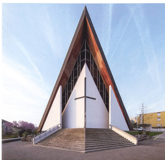
Dielsdorf, Buchserstrasse 12, kath. Kirche St. Paulus, erbaut 1962 nach Plänen des Architekten Justus Dahinden (1925–2020).

derheit, Kirchen für die katholischen Zuwanderer erbaut werden. Dabei entstanden einige qualitativvolle Bauwerke von grosser architektur- und sozialgeschichtlicher Bedeutung wie etwa die Wohnblocksiedlung Sonnhalde der Ernst Göhner AG (1969–1979) in Adlikon bei Regensdorf oder die katholische Kirche St. Paulus in Dielsdorf von Architekt Justus Dahinden (1925–2020). Bemerkenswert sind ausserdem die zahlreichen landwirtschaftlichen Aussiedlungen, die einerseits in den 1920er Jahren im Zuge der Trockenlegung der Riede entlang der Glatt und im Furttal, andererseits in Folge der Güterzusammenlegungen der 1960–1980er Jahre entstanden sind und von einem tiefgreifenden Wandel der Kulturlandschaft zeugen. ●