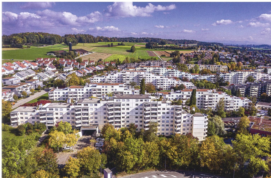
Adlikon bei Regensdorf, Siedlung Sonnhalde, erbaut 1969–1979.

Begünstigt von der Zunahme des motorisierten Individualverkehrs und dem Ausbau des öffentlichen Verkehrs, wandelten sich die meisten Bauerndörfer des Bezirks in der zweiten Hälfte des 20. Jahrhunderts zu Agglomerationsgemeinden. Das damit einhergehende Bevölkerungswachstum brachte neue Bauaufgaben mit sich: So mussten nicht nur ganze Wohnsiedlungen, sondern auch neue Schulhäuser sowie, als Beson-