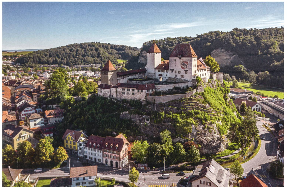
Am höchsten Punkt der Stadt: Schloss Burgdorf, die Westfassade der Kernburg mit Berner Wappen.