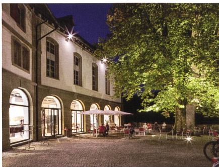
Die Linde beim Schlosshof, die früher als Gerichtslinde diente und heute für ein angenehmes Klima beim Restaurant sorgt.

Die Baugeschichte der Anlage über die Jahrhunderte fördert spannende Fakten und Erkenntnisse zutage. So betonten einige Umbauten wie etwa die Neukonstruktion des Palastdachstuhls die Herrschaftskontinuität, andere wie die Unterteilung der Säle in kleinere Räume die Funktionalität einer Landvogtei. Dank der fortgesetzten Nutzung und dem geleisteten Bauunterhalt haben Stadt und Republik Bern das Schloss während mehr als 600 Jahren vor dem Ruin bewahrt. Dem Autorentrio Jürg Schweizer,