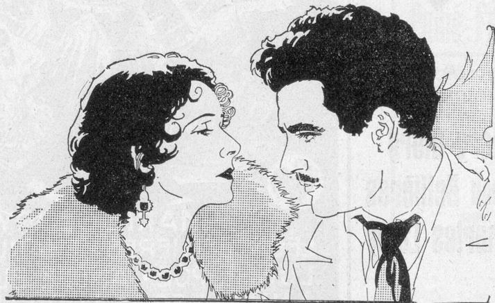
Norma Talmadge et Gilbert Roland dans „Nuits de New-York“.

Il semble qu'en Suisse, le parlant a amené au cinéma de nombreux nouveaux fidèles. Les recettes sont généralement en augmentation notable ; heureusement d'ailleurs, car les prix de location eux aussi sont en grande hausse.