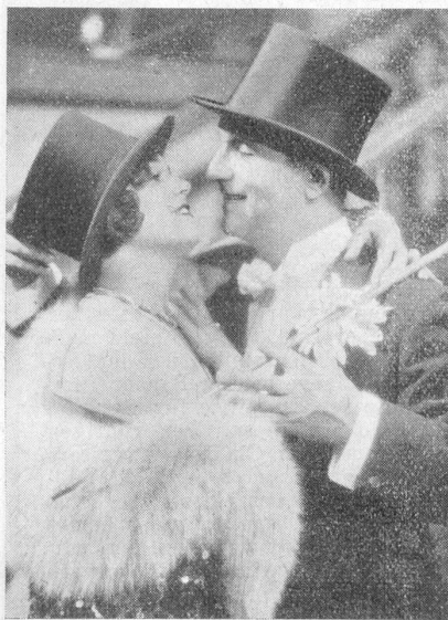
Michael Bohnen et Olga Tschechowa in Zwei Krawatten .