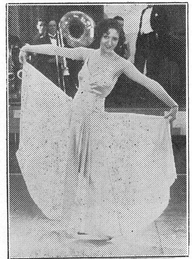
Service de Nuit

» Néanmoins je me sens à mon aise... » Diable! les Vignes du Seigneur ... N'est-ce pas mon cheval de bataille? »