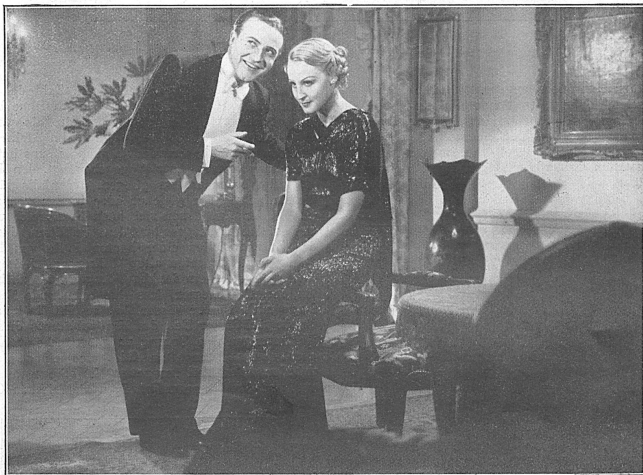
Brigitte Helm und Willy Fritsch in dem grossen Ufa-Film Die Insel.